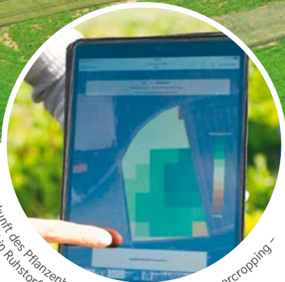
Zukunft des Pflanzenbaus auf dem Schirm: Strip-Intercropping – das Feld in Ruhstorf a.d.Rott aus der Luft und auf dem Tablet

Erst vor kurzem bezog die LfL den liebevoll renovierten Gutshof des Schlosses Kleeberg in Ruhstorf an der Rott.