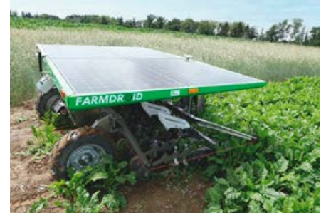
Im bayerischen Rübenanbau bereits bewährt: der autonome Feldroboter Farmdroid