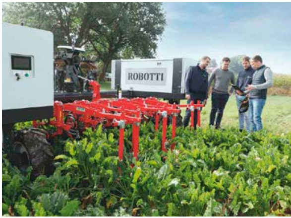
Modernste Agrartechnik: Der Rübenroboter kann über Tablet gesteuert und mit Rübensamen befüllt werden, Handsensoren messen den Nährstoffbedarf der Pflanzen (rechts).