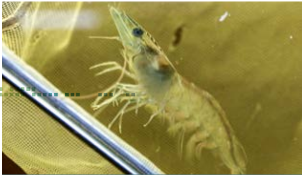
Unterstützung durch das Institut für Fischerei: Bayerische Garnelen aus nachhaltigem Aquafarming nicht nur für deutsche Spitzenköche