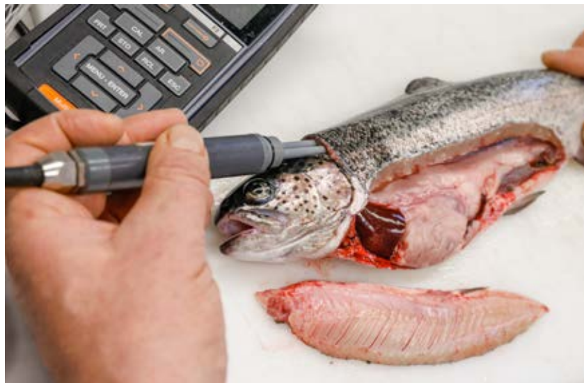
Qualitätscheck nach der Schlachtung: Messung von Leitfähigkeit und pH-Wert des Fischfleisches