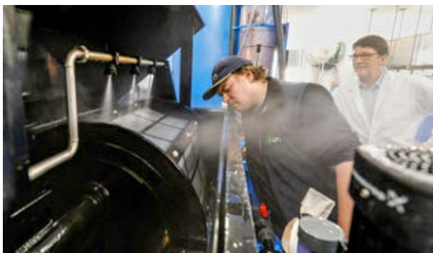
Wassersparend: Moderne MikrosiebfILTER reinigen rückstandlos und ermöglichen geschlossene Kreisläufe