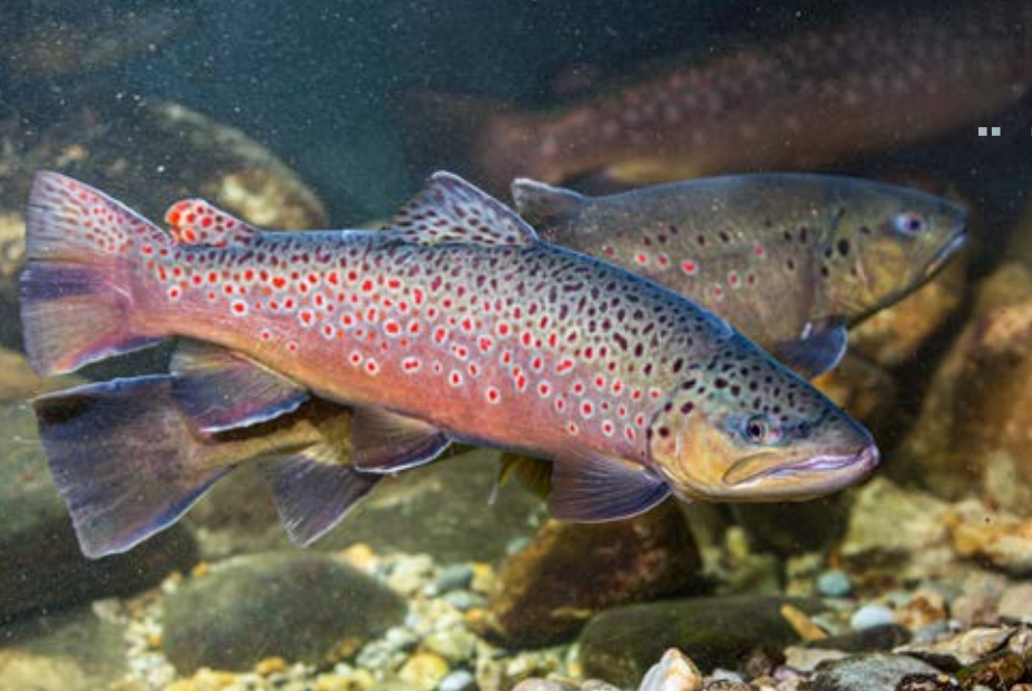
Wohlbefinden kann man auch sehen: Stressfreie Starnberger Bachforellen sind gesund und haben keine Verletzungen

Die landwirtschaftliche Forschung beschäftigt sich derzeit verstärkt mit der Nachhaltigkeit und Regionalität beim Tierfutter. Gibt es solche Fragen beim Fischfutter auch?