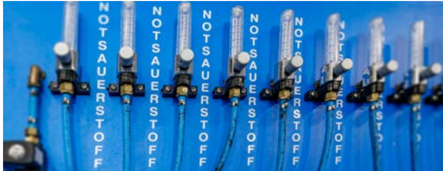
Wie in der Medizin: Aktuelle Aquakultur verwendet modernste Mess- und Regeltechnik