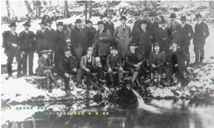
Standort für Fischerei schon zu König Ludwigs Zeiten: Einer der ersten Fischereilehrgänge (1913) in der damaligen Bayerischen Fischereischule in Starnberg