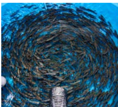
Verzicht auf Fischmehl, auch schon bei der Aufzucht: In Starnberg wird an der Substitution mit Fliegenmaden (oben) und Reststoffen der Rapsölproduktion gearbeitet