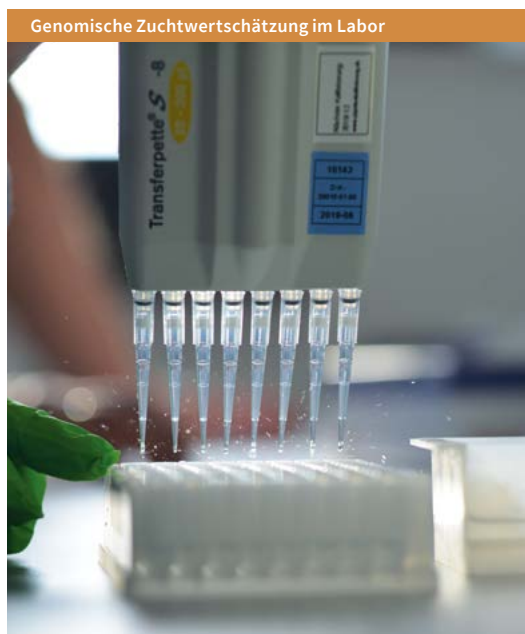
Genomische Zuchtwertschätzung im Labor

Im Zuge der kritischen Auseinandersetzung mit der konventionellen Landwirtschaft und geänderten gesellschaftlichen Einstellungen ist in den letzten Jahren auch die Tierzucht ins Visier von Kritikern geraten. Der Vorwurf galt vor allem einer allein auf Leistung ausgerichteten Zuchtwertschätzung. Dabei wurde oftmals übersehen, dass Leistung in der Tierzucht schon seit vielen Jahren nicht mehr einseitig als Milch- oder Fleischmenge definiert wird und dass ein Großteil der Leistungssteigerungen in den vergangenen Jahrzehnten auf die Optimierungen in Haltung, Fütterung und Management zurückzuführen waren, nicht auf die Genetik. Gleichwohl tragen Züchter Verantwortung für die in einigen Bereichen negativen Folgen einer zu starken Fokussierung der Zucht auf produktionsrelevante Merkmale. Das Institut für Tierzucht an der LfL ist sich seiner Führungs- und Vorbildfunktion als staatliche Institution bewusst und hat seine von jeher solide Zuchtarbeit auf Ausgewogenheit und genetische Vielfalt ausgerichtet. Langlebigere, fruchtbarere und gesündere Tiere sind den bayerischen Zuchtprogrammen nicht erst seit gestern ein Anliegen. Vor allem in den letzten ein bis zwei Jahrzehnten konnte zum Beispiel im Fitnessbereich ein deutlicher Zuchtfortschritt erzielt werden.