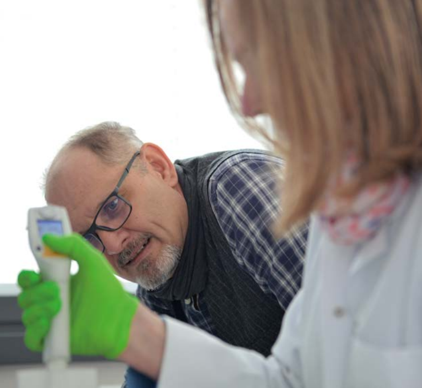
Modernste Labortechnik im Dienste der Züchtung

Die Tierzucht hat das Aussehen, die Leistungen und das Verhalten von Tieren schon immer verändert. Lange Zeit aber erfolgte Züchtung eher planlos und im privaten Rahmen. Erst an der Wende zum 20. Jahrhundert erkannte man, dass für die systematische Ausnutzung der natürlichen genetischen Variabilität eine möglichst breite Basis objektiver Leistungsdaten und genaue Abstammungsaufzeichnungen notwendig sind. Zunächst konzentrierte man sich dabei auf Zuchtziele, die in erster Linie leicht messbare Leistungseigenschaften wie Milch, Fleisch oder Eier im Blick hatten und darüber hinaus eine relativ hohe Erblichkeit (Heritabilität) aufwiesen. Dank Digitalisierung und komplexen genetisch-statistischen Methoden hat die moderne Tierzucht, wie sie heute am Institut für Tierzucht praktiziert wird, ein nie dagewesenes Niveau und einen enormen Organisationsgrad erreicht. Dies garantiert den fast völligen Wegfall unerwünschter genetischer Besonderheiten und ausgewogene Gesamtzuchtziele und erleichtert die Züchtung in Merkmalen, die niedriger erblich sind.