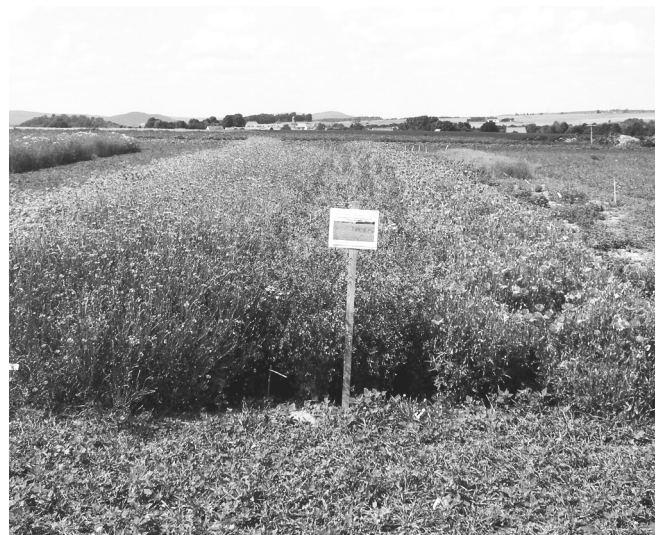
■ Vor der Aussaat auf den Ackerflächen von Biobetrieben muss das Saatgut der autochthonen Ackerwildkräuter vermehrt werden – wie hier auf der Domäne Frankenhäusen in Hessen.

Als Beweggründe für eine mögliche Teilnahme an Maßnahmen zum Ackerwildkrautschutz nannten die Befragten „Förderung der Artenvielfalt“, „Verantwortung gegenüber Natur und Umwelt“, „Nutzen für den Biobetrieb“ sowie „Freude an Natur und Naturbeobachtung“. Unter „Nutzen für den Biobetrieb“ wurden positive Nebenwirkungen auf Kulturpflanzen, Bodenfruchtbarkeit und auf den Ackerbau allgemein verstanden. Zahlreiche Landwirte hatten sich mit dem Thema bereits auseinandergesetzt. Sie verwiesen zum Beispiel auf eigene Erfahrungen und äußerten Ideen für die Umsetzung. Drei Viertel der Befragten möchten weiter über das Thema informiert werden und sind an Forschungsergebnissen interessiert. Die Antworten weisen darauf hin, dass bereits heute in vielen Biobetrieben fundiertes Praxiswissen zum Ackerwildkrautschutz vorhanden ist.