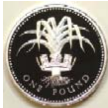
Abbildung eines Lauchs auf einem britischen Pfundstück

Der Lauch, auch als Porree, Küchen-, Breit-, Beiss- oder Winterlauch bekannt, kommt aus dem südeuropäischen und vorderasiatischen Raum. Dort wurde er schon früh von den Ägyptern, Griechen und Römern kultiviert. Durch die Römer gelangte er vermutlich auch nach Großbritannien, wo er noch heute ein beliebtes Gemüse ist und sogar als Wahrzeichen verwendet wird. In einigen Ländern wie z. B. den USA ist er dagegen kaum bekannt.