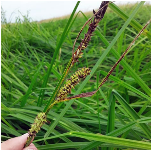
Beispiel für Paludikultur: Sumpf-Segge ( Carex acutiformis )