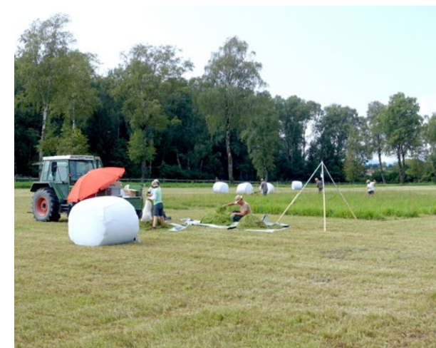
Ernte im Parzellenversuch mit verschiedenen Grünlandmischungen auf der Versuchsstation Karolinenfeld.