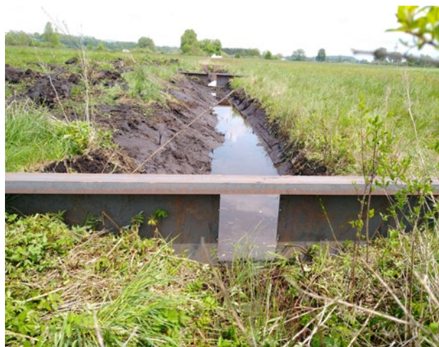
Einbau von Stauwehren im Freisinger Moos.

Moorböden bestehen fast nur aus Torf, abgestorbenem Pflanzenmaterial, das bis zu 10.000 Jahre alt ist. Im entwässerten Zustand lösen sich Moorböden quasi in Luft auf: Mikroorganismen zersetzen den Torf zu Kohlendioxid (CO 2 ) und anderen Treibhausgasen. Tief entwässerte Moorböden sacken jedes Jahr um ein bis vier Zentimeter und emittieren über 30 Tonnen CO 2 -Äquivalente pro Hektar. Dies entspricht in etwa den Emissionen einer Person, die zehnmal mit dem Flugzeug von München nach New York und zurück fliegt. Erst ein mittlerer Wasserstand von weniger als 30 cm unter Flur kann die Zersetzung des Torfes bremsen oder stoppen. Dieser wichtige Beitrag zum Klimaschutz erfordert erhebliche Anpassung in der Nutzung und Bewirtschaftung.