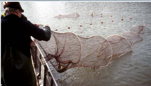
Stellnetz- (oben) und Reuse (unten), die Hauptfanggeräte der Berufsfischer.