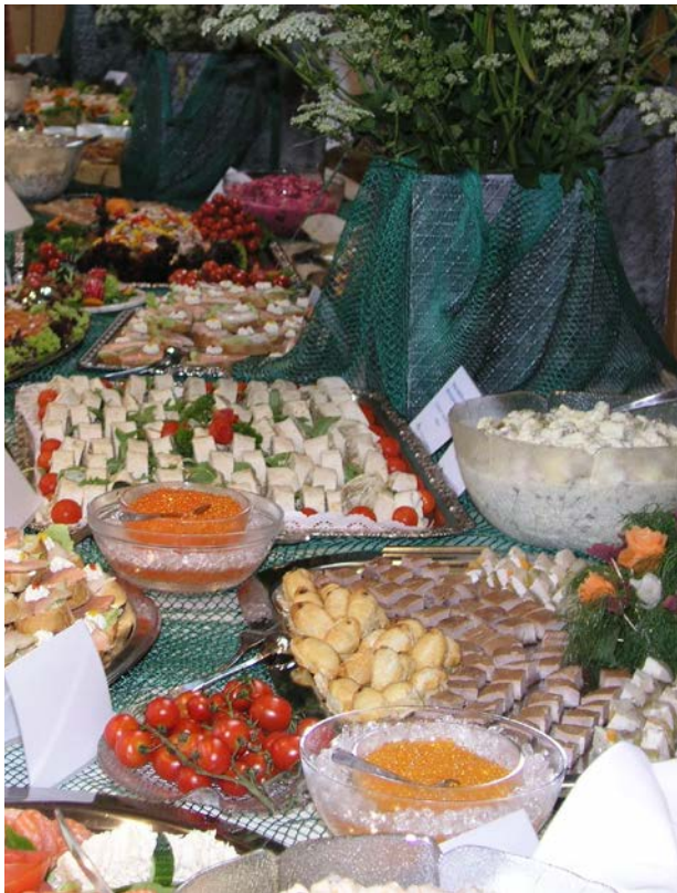
Die Palette der Fischprodukte aus der Fluss- und Seenfischerei ist vielfältig.

Die verschiedenen heimischen Fischarten und die unterschiedlichen Zubereitungsmethoden eröffnen eine reichhaltige Palette an heimischen Fischspezialitäten für nahezu jeden Geschmack.