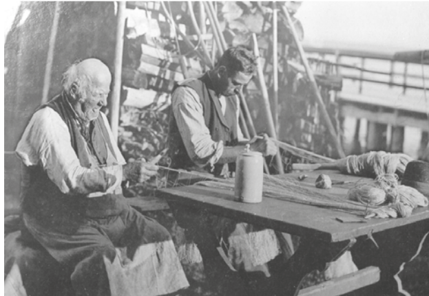
Eindrücke aus der Vergangenheit, © Johann Strobl.