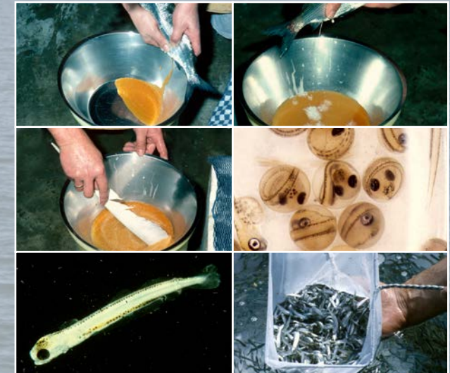
Künstliche Vermehrung von Renken/Felchen in einer Fischbrutanstalt.

Bei nicht ausreichender natürlicher Vermehrung werden die Fischbestände durch künstliche Erbrütung (meist in eigenen Brutanstalten) und Besatzmaßnahmen gefördert. So kann der fischereiliche Ertrag gestützt und gleichzeitig die Arterhaltung gewährleistet werden.