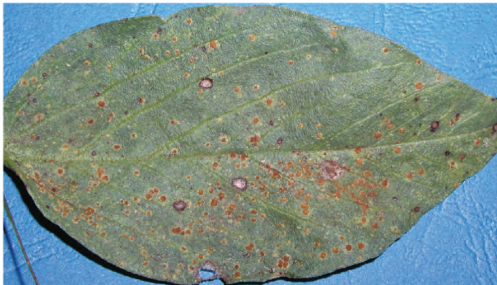
Abb. 6: Komplexinfektion, überwiegend Ackerbohnenrost mit den hellbraunen Rostpusteln

Kleine rostfarbene Pusteln an Blattober- und unterseite, die später braun bis schwarz werden können (Abb. 7). Vor allem bei spät entwickelten Pflanzen kann dies zu Ertragsminderungen führen. Der Befall findet von Juni bis August statt und wird durch feuchtwarme Witterung begünstigt.