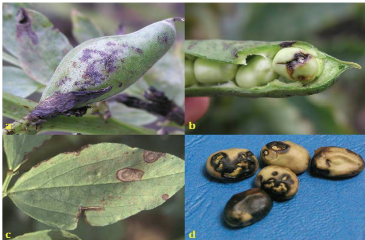
Abb. 5: Schadbild der Brennfleckenkrankheit an Blatt, Hülse und Samen

Bereits vor der Blüte treten hellbraune, bis 1 cm große Flecken mit dunkler Umrandung auf. Im Zentrum sind zahlreiche schwarze Pyknidien zu sehen (siehe Abb. 6 c). Problematisch ist der Befall der Hülse, wenn sich von dort aus der Erreger weiter auf die Samen ausbreitet (Abb. 6 a, b, d).