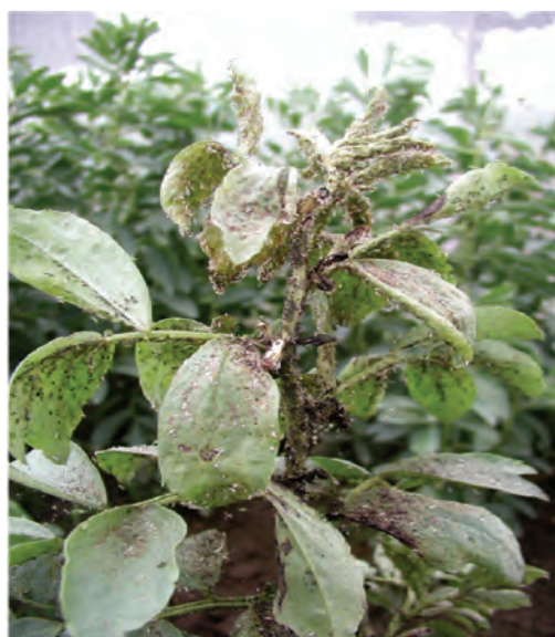
Abb. 1: Massiver Lausbefall

Bekämpfung: Bestände ab Mai regelmäßig kontrollieren. Derzeit sind wirksame Präparate zugelassen.