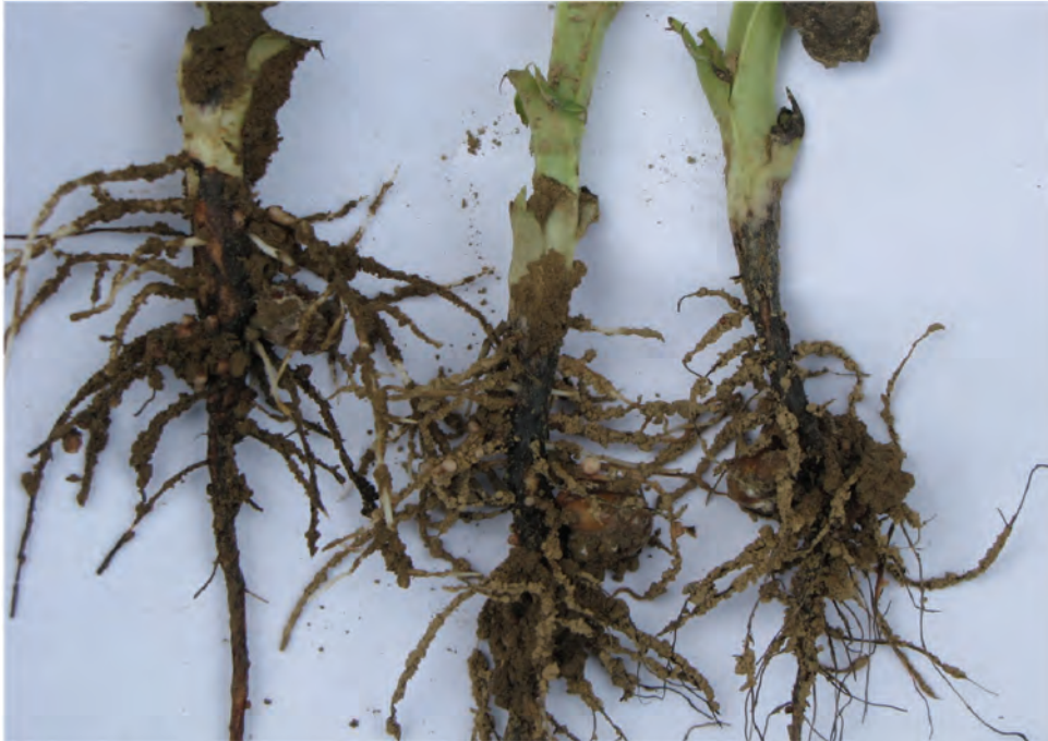
Abb. 7: Typisches Schadbild des Fußkrankheitskomplexes an den Wurzeln und der Stängelbasis von Ackerbohnen

Verringerte Triebkraft junger Pflanzen führt zu vorzeitigem Absterben der Blätter und Einschränkung der Hülsenentwicklung. Eine Braun- und Schwarzfärbung von der Wurzel an beginnend tritt auf (Abb. 8). Später beginnt die Pflanze zu vermorschen. Die Krankheit ist meist ein Erregerkomplex verschiedener Schadpilze und kann sich etablieren durch Hafer, Kleearten, Erbsen und Wicken.