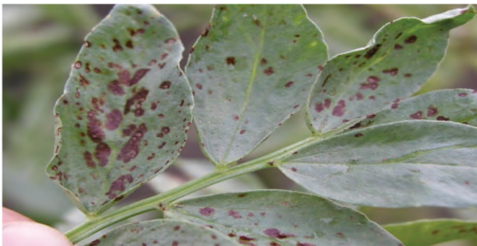
Abb. 4: Typische Symptome der Schokoladenfleckenkrankheit an den Blättern von Ackerbohne

Nach der Blüte erscheinen kleine runde, rotbraune Flecken mit hell glänzendem Zentrum (Abb.5). Der Stängel kann ebenfalls befallen werden. Im schlimmsten Fall können ganze Pflanzen absterben. Feuchtwarme Witterung fördert das Pilzwachstum.