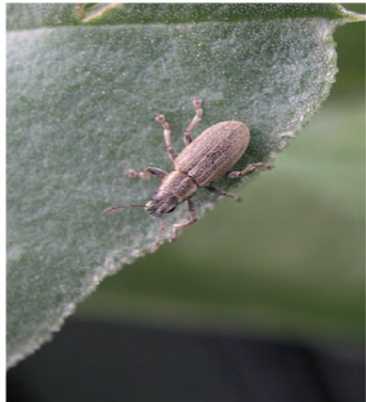
Abb. 2: Adultes Tier des Blattrandkäfers

Bekämpfung: Durch die Vielzahl der Wirtspflanzen ist die Bekämpfung eher schwierig. Für Stärkung der Pflanze durch angepasste Düngung sorgen. Anbaupausen von mindestens 4 bis 5 Jahren einhalten und die Distanz der Leguminosenschläge maximieren. Eine chemische Bekämpfung lohnt sich erst bei dichtem Befall von 5 bis 10 Käfer pro m 2 .