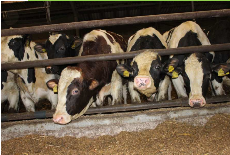
Fleckvieh stark im Fleisch