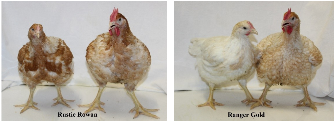
Abbildung 2: Die Herkünfte Rustic Rowan (links) und Ranger Gold (rechts) an Lebenstag 49. Zu sehen sind jeweils Henne und Hahn.

Jedes Abteil hatte eine Grundfläche von 10 m 2 und wurde mit Strohpellets (1,6 kg/m 2 ) eingestreut. Je Herkunft standen fünf Wiederholungen zur Verfügung, die in einem randomisierten Blockdesign angeordnet waren (Abbildung 3). Bei RuGo, RuRo und RaGo wurden 100 Tiere/Abteil eingestallt. Aufgrund einer zu geringen Schlupfrate standen bei RaCl nicht ausreichend Tiere zur Verfügung, weshalb bei dieser Herkunft 72 Tiere/Abteil eingestallt wurden.