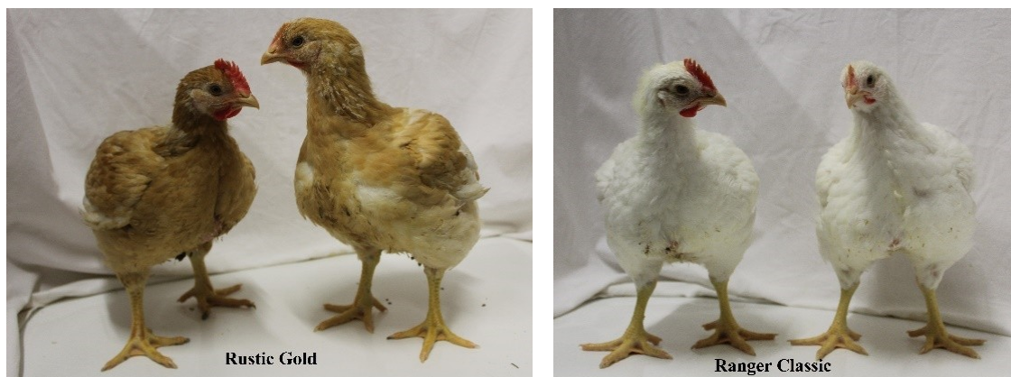
Abbildung 1: Die Herkünfte Rustic Gold (links) und Ranger Classic (rechts) an Lebenstag 37. Zu sehen sind jeweils Hahn und Henne.

Für die Untersuchung wurden insgesamt 1.860 Eintagsküken von vier langsam wachsenden Masthühnerherkünften gemischtgeschlechtlich (je Abteil 50 % ♂/50 % ♀) in 20 Abteile am Versuchs- und Bildungszentrum Geflügel, Staatsgut Kitzingen, in Bodenhaltung eingestallt. Es wurden die Herkünfte Rustic Gold (RuGo) und Ranger Classic (RaCl) (Abbildung 1) sowie Rustic Rowan (RuRo) und Ranger Gold (RaGo) (Abbildung 2) eingesetzt.