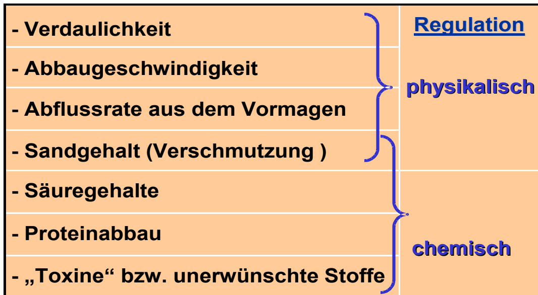
Abbildung 1: Einflussgrößen der Silagequalität auf den Futtermverzehr (silage quality and feed intake)

Verdaulichkeit, Abbaugeschwindigkeit und Abflussrate bestimmen die Kapazität zur Futteraufnahme im Vormagen. Von besonderer Bedeutung ist eine hohe Verdaulichkeit des Grobfutters insbesondere zu Beginn der Laktation. Deutlich wird dies an einer Auswertung von Gruber (2003) (siehe Abbildung 2). Bei den Grobfutter betonten Rationen aus Österreich (Gruber et al., 2001) führte die Steigerung des Energiegehalts um 1 MJ NEL/kg TM im Grobfutter zu einer Mehraufnahme von 2 kg TM je Kuh und Tag. Die vergleichende