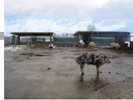
Genug Platz und Bewegung