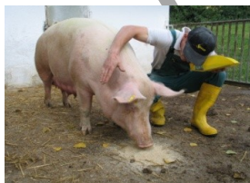
Guter Mensch- Tier-Kontakt