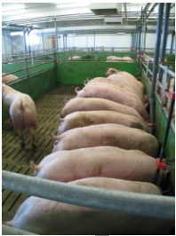
Ausreichend und gutes Futter