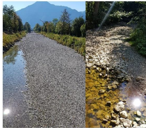
Wassermangel und steigende Wassertemperaturen machen den Fischbeständen zunehmend Probleme.