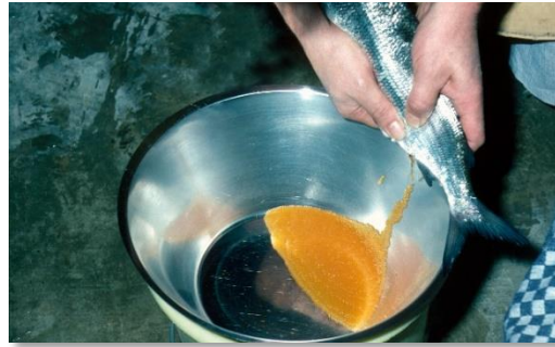
Abstreifen eines Renken-Rogners.

18.30 Uhr: Geselliger Abend im „Gasthaus zur Sonne“, Starnberg