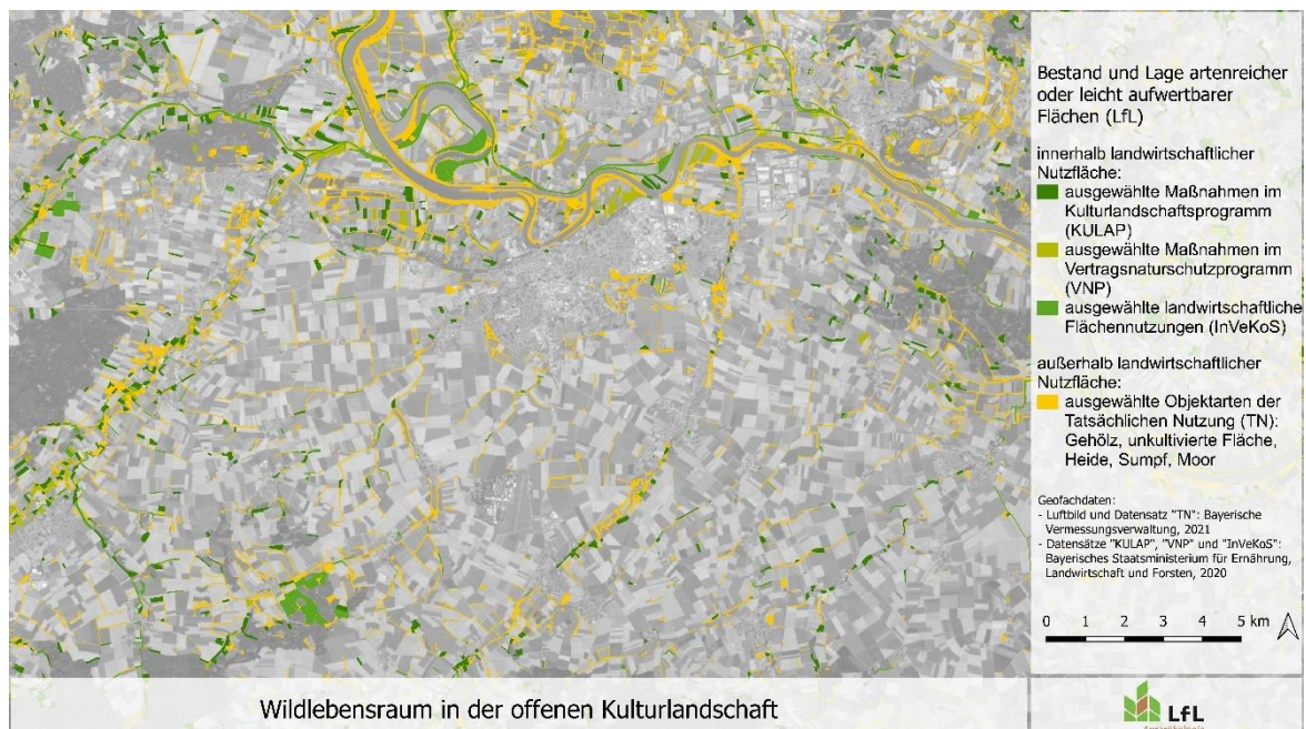
Abb. 2: Schematisch dargestellter Landschaftsausschnitt

**die genannten Datenquellen entsprechen dem Stand zum Zeitpunkt der Veröffentlichung und sind nicht als abschließend zu betrachten