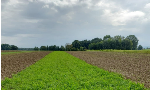
Abbildung 1: Erbsen-Wicken-Gemenge im Versuch

In Tabelle 2 sind die in der Fruchtfolge angebauten Zwischenfrüchte sowie die mineralische N-Düngung (Kalkammonsalpeter) aufgeführt. Ab dem 15. Versuchsjahr wurde die Düngung den allgemeinen Ertragsteigerungen angepasst. Daher wurde bei den Getreidefrüchten die mineralische Düngung bei den N-Stufen 2 bis 5 ab 1999 erhöht (Tabelle 2).