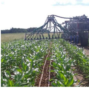
Abbildung 1: Gülledüngung mit einem Versuchsgüllefass im internationalen organischen Stickstoffdauerversuch (IOSDV) in Puch

Die ab der sechsten Rotation gegebenen Düngermengen zeigt Tabelle 2 . Die mineralische N-Düngung zu den einzelnen Varianten umfasste eine große Spannweite. Dabei entspricht, über eine Rotation betrachtet, Stufe 5 einer N-Menge, die bewusst hoch angesetzt wurde und in der Rotation insgesamt über der heute in der Praxis nach Düngeverordnung möglichen Maximalmenge liegt. Bei Mais wurde bei der Saat eine Unterfußdüngung mit Kalkammonsalpeter in Höhe von 30 kg N/ha durchgeführt. Bei Winterweizen und Wintergerste verblieb zudem das Stroh auf dem Feld.