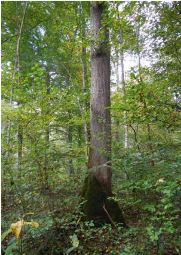
Abbildung 2: Mit charakteristischen Brettwurzeln ausgestattete Flatterulme im Forstbetrieb Landsberg, Revier Eurasburg, am Starnberger See