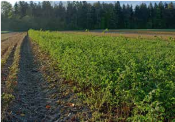
Abbildung 7: Einjährige Sämlinge der Flatterulme am Pflanzgartenstützpunkt in Laufen

BaySF erste umfangreiche Erntemaßnahmen im Isarauwald am Forstbetrieb Freising durchgeführt. Dabei wird der aktuell noch überschaubare Pflanzenbedarf überwiegend durch die Beerntung von Einzelbäumen gedeckt, als wesentliches Auswahlkriterium wird die Vitalität der beerntbaren Bäume herangezogen.