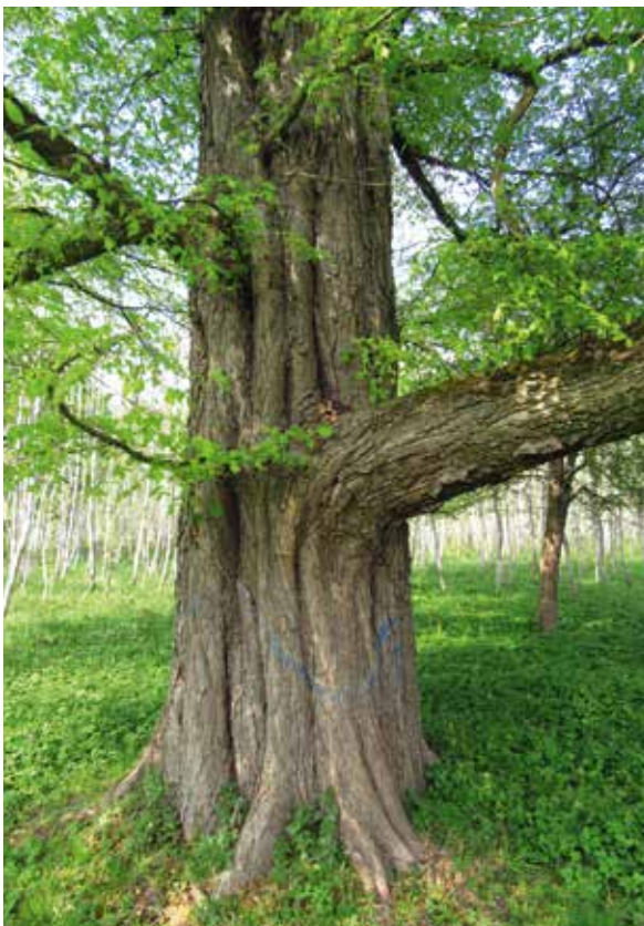
Abbildung 6: Eine alte Flatterulme im Freisinger Stadtwald

Die Flatterulme hingegen ist deutlich weniger anfällig, sonst wären die Altbäume nicht mehr existent. Abgänge, die gelegentlich zu finden waren, hatten unklare Gründe, sodass ein Befall mit Ophiostoma novo-ulmi / Ophiostoma ulmi eher die Ausnahme sein dürfte. Da viele Flatterulmen in der Nähe von Kleingewässern zu finden sind, unterliegen sie einer nicht unbeträchtlichen Gefahr durch den Biber, der selbst vor älteren Exemplaren nicht Halt macht.