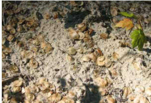
Abbildung 4: Flatterulmensamen in der Marzlinger Au

Weil die natürlichen Prozesse nur selten funktionieren, bringt der Forstbetrieb Freising die Flatterulme durch Pflanzung in den Wald. Aus autochthonem Saatgut im BaySF-Pflanzgartenstützpunkt Laufen gezogen, wurden in den vergangenen Jahren zehntausende Ulmen