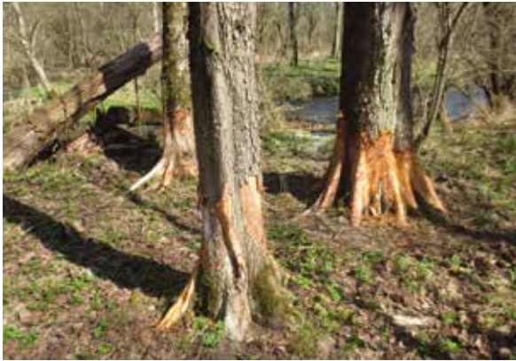
Abbildung 5: Biberschäden an Flatterulmen in der Hummler AU

Die Flatterulme hingegen ist deutlich weniger anfällig, sonst wären die Altbäume nicht mehr existent. Abgänge, die gelegentlich zu finden waren, hatten unklare Gründe, sodass ein Befall mit Ophiostoma novo-ulmi / Ophiostoma ulmi eher die Ausnahme sein dürfte. Da viele Flatterulmen in der Nähe von Kleingewässern zu finden sind, unterliegen sie einer nicht unbeträchtlichen Gefahr durch den Biber, der selbst vor älteren Exemplaren nicht Halt macht.