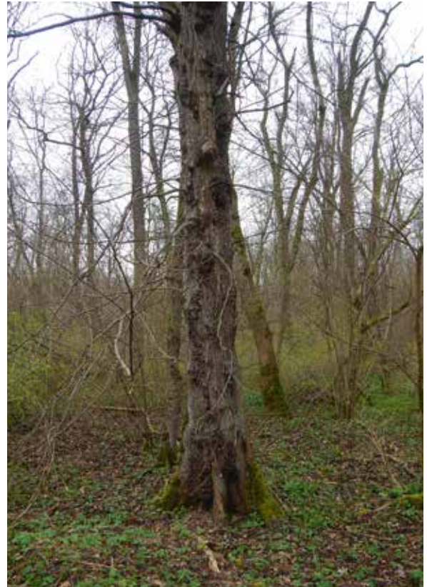
Abbildung 3: Flatterulme im Forstbetrieb Weißenhorn mit charakteristischen Maserknollen

Edellaubbäume gemäß Pflanzrichtlinie der BaySF von 2 m x 1,5 m bzw. 1,5 m x 1,5 m werden ca. 3.300–4.400 Pflanzen pro ha gesetzt. In der Praxis hat sich ein Einzelschutz mit Wuchshüllen als günstig für eine erfolgreiche Kultur erwiesen – dies schützt zum einen gegen Wildschäden und fördert das Wachstum deutlich, zum anderen wird das Wiederauffinden der Pflanzen zur Kulturpflege bei üppiger Begleitvegetation, insbesondere im Auenwald, erleichtert.