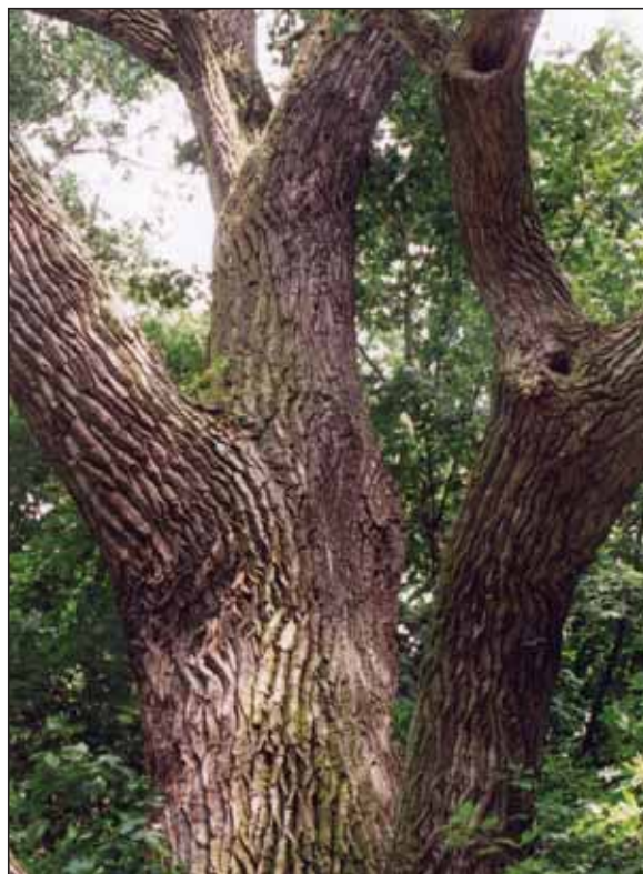
Abb. 1: Starkastige Krone einer alten Schwarzpappel

Die wiederholte Erwähnung der Schwarzpappel in den Epen Ilias und Odyssee zeigt, dass ihr Vor-