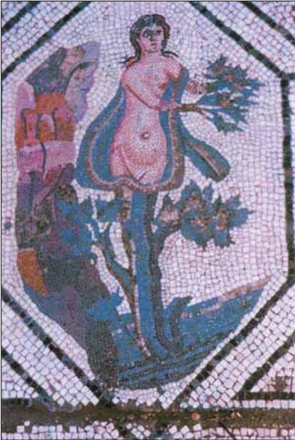
Abb. 2: Eine Tochter des Helios verwandelt sich in eine Pappel; Mosaik in einem römischen Haus in Tunesien, Datierung unsicher, vermutlich 3. Jahrhundert n. Chr.

Schwarzpappeln verwandelt, ihre leuchtenden Tränen flossen als Bernstein (ἤλεκτρον, Elektron) zu Boden.