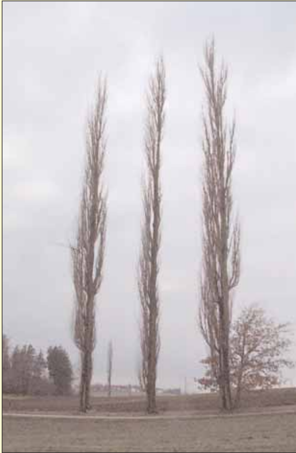
Schwarzpappel am Weg