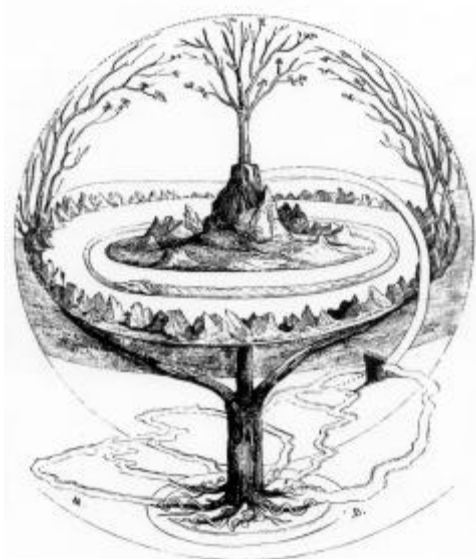
Abb. 5: Der Aufbau der Welt nach nordgermanischer Überlieferung

Ich hatte oben bereits erwähnt, dass man die Weltesche der nordischen Quellen mit ähnlichen Überlieferungen eines Weltenbaums verglichen hat, die in weiten Teilen Eurasiens anzutreffen sind. Mit diesem Baum ist häufig die Vorstellung verbunden, er stünde im Zentrum der Welt und verbände die verschiedenen Schichten (Unterwelt, Erde, Oberwelt) eines vertikal gegliederten Kosmos. Auch erfüllt er die Funktion, diese verschiedenen Schichten auseinander zu halten (Abb. 5). Dass wir diese Vorstellung auch bei den Germanen voraussetzen können, zeigt der Bericht des Rudolf von Fulda ( Translatio Alexandri ) über die 772 von Karl dem Großen zerstörte irminsûl , dem zentralen Heiligtum der heidnischen Sachsen. Er nennt sie eine universalis columna, quasi sustinens omnia ('eine Weltsäule, gleichsam alles tragend').