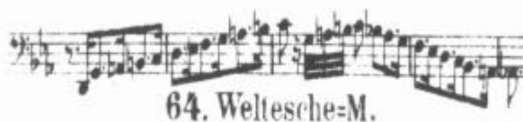
Abb. 2: Das Weltesche-Motiv aus Richard Wagners 'Götterdämmerung'

Schon in dieser Eingangsszene der Götterdämmerung wird durch die dritte Norn in prophetischer Zukunftschau unmissverständlich darauf hingewiesen, dass der von Wotan begangene Baumfrevl letztlich zu einer Katastrophe kosmischen Ausmaßes führen wird. Am Schluss der Oper erfüllt sich diese Prophezeiung. Als sich Brünhild mit ihrem Ross in Siegfrieds brennenden Scheiterhaufen stürzt, um wenigstens im Tod mit ihm vereint zu sein, wird nicht nur die Halle der Gibichungen ein Raub der Flammen, diese lodern vielmehr bis zum Himmel empor und schlagen in die um Walhall aufgeschichteten Scheite der Weltesche (hier klingt in der Oper noch einmal kurz das Weltesche-Motiv auf; Abb. 2). Götter und Helden und damit die ganze alte Welt gehen in diesem gewaltigen Brand zugrunde.