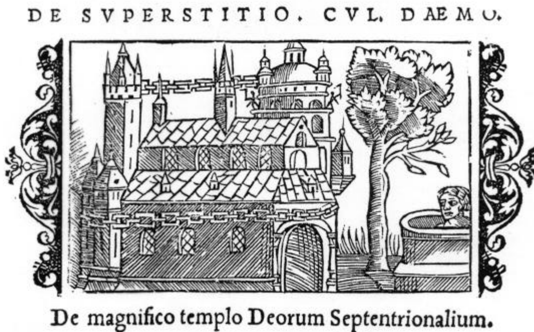
Abb. 4: Der Tempel mit Baum und Quelle in Uppsala; Holzschnitt aus der 'Geschichte der mitternächtigen Völker' (Rom 1544) des Schweden Olaus Magnus

Nahe diesem Tempel steht ein sehr großer Baum, der weithin seine Äste ausbreitet, die im Sommer wie im Winter stets grün sind. Keiner kennt seine Art. Dort befindet sich auch eine Quelle, an der die Heiden zu opfern und in der sie einen lebenden Menschen zu versenken pflegen.