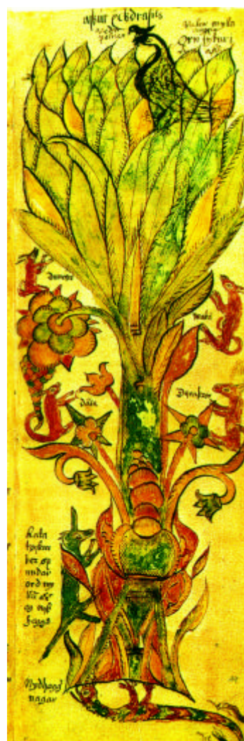
Abb. 3: Die Weltesche Yggdrasil aus einer isländischen Handschrift von 1680 (AM 738 4 o )

Die Esche ist der größte und beste aller Bäume. Ihre Zweige breiten sich über die ganze Welt aus und erstrecken sich über den Himmel. Drei Wurzeln richten den Baum auf und liegen besonders breit: Eine liegt bei den Asen, die zweite bei den Reifriesen, dort wo einst das Ginnungagap war. Die dritte erstreckt sich über Niflheim, und unter dieser Wurzel liegt Hwergelmir, und Nidhögg nagt an ihrer Wurzel von unten. Aber unter der Wurzel, die sich bei den Reifriesen hinzieht, ist die Quelle Mimirs, in der Klugheit und Verstand verborgen sind. [...] Dorthin kam Allvater und erbat sich einen Trunk aus ihr. Aber er bekam nichts, bevor er sein Auge als Pfand gab. [...] Die dritte Wurzel der Esche liegt im Himmel, und unter ihr ist eine Quelle, die sehr heilig ist. Sie heißt Urdbrunnen. Dort haben die Götter ihre Gerichtsstätte. [...] Dort steht eine prächtige Halle an der Quelle unter der Esche. Aus ihr kommen drei Mädchen, die Urd, Werdandi und Skuld heißen. Diese Mädchen entscheiden über die Lebenszeit der Menschen. Wir nennen sie Nornen. [...] Ein Adler sitzt in den Ästen der Esche, der hat manches Wissen, und zwischen seinen Augen sitzt der Habicht mit Namen Wedrfölnir. Das Eichhörnchen, das Ratatosk heißt, springt an der Esche hinauf und herunter. Zwischen dem Adler und Nidhögg tauscht es Gehässigkeiten aus. Vier Hirsche dringen ins Geäst und beißen die Blätter ab. Sie heißen Dainn, Dwalinn, Duneyr, Durathror. So viele Schlangen sind in Hwergelmir bei Nidhögg, daß keine