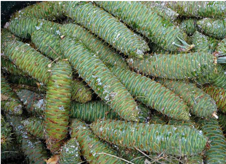
Weißtannen-Zapfen von der Samenplantage Wiedmais

Das AWG Teisendorf und der Pflanzgartenstützpunkt (PGS) Laufen der Bayerischen Staatsforsten (BaySF) starten einen Gemeinschaftsversuch zur Lagerung von Weißtannen-Saatgut.