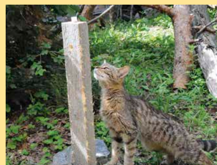
Wildkatze beim Lockstock