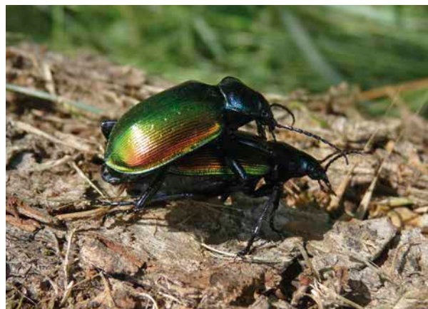
Großer Puppenräuber

Puppenräuber gefunden? Meldung an: Puppenraeuber@lwf.bayern.de www.forst.bayern.de/naturwaelder