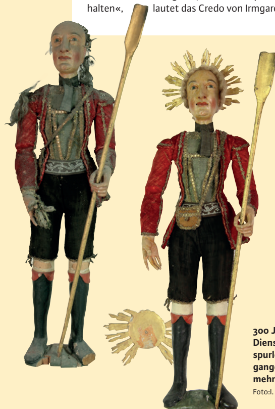
300 Jahre sind an den Dienstboten nicht spurlos vorbeigegangen. Eine Kur war mehr als nötig.