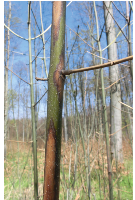
2. Rindennekrosen und abgestorbener Trieb