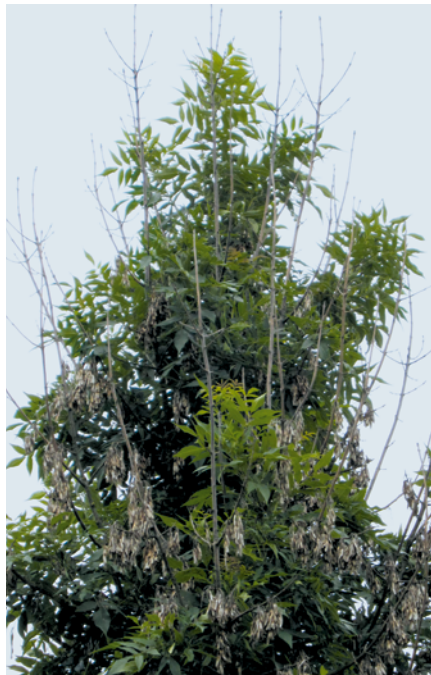
4. Abgestorbene Triebe in der Lichtkrone einer etwa 10-jährigen Esche