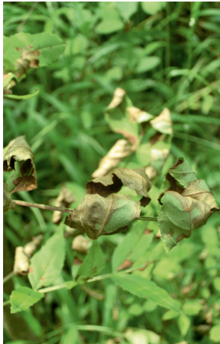
1. Verfärbte Blätter

Unregelmäßige Farbveränderungen an den Blattspreiten der Fiederblätter (Bräune) zeigen eine erste Infektion (Abbildung 1). Zeitlich deutlich verzögert werden dann beige-braune bis orange-braune Rindennekrosen an den Trieben sichtbar, die im unbelaubten Zustand sehr deutlich zu erkennen sind (Abbildung 2). Das Holz unterhalb dieser Nekrosen ist blau-grau bis dunkelbraun verfärbt. Diese Holzverfärbung ist allerdings nicht auf den Bereich der Nekrose beschränkt, sondern setzt sich ober- und unterhalb fort. Die Rindennekrosen können bereits im Herbst des Infektionsjahres oder auch erst im folgenden Frühjahr erkennbar werden. Triebumfassende Nekrosen unterbrechen die Wasserversorgung des Astes, so dass Pflanzenteile oberhalb der Nekrose welken und absterben (Abbildung 3). Da zu diesem Zeitpunkt noch keine Trennungszone ausgebildet wird, bleiben die Blätter noch längere