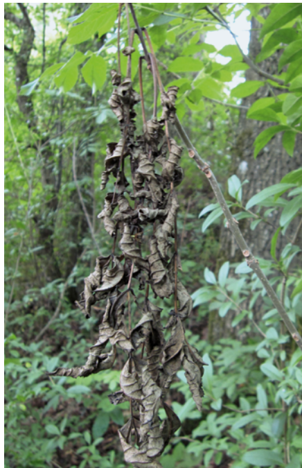
3. Abgestorbene Blätter, die nicht aktiv abgeworfen werden können