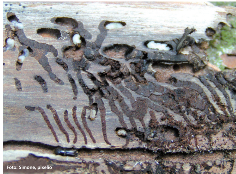
Abbildung 2: Die Klimaerwärmung macht's möglich. Der Buchdrucker wird bei verlängerten Vegetationszeiten in Zukunft noch öfter als bisher mehrere Generationen im Jahr anlegen können; Brutbild mit Larven, Puppen und Jungkäfern.

Die Informationen sollen die Waldbesitzer über eine Internet-gestützte Plattform erreichen, auf der die dezentralen Erkenntnisse der Ämter für Ernährung, Landwirtschaft und Forsten (ÄELF) mit denen des Sachgebietes Waldschutz als Stabsstelle verknüpft werden.