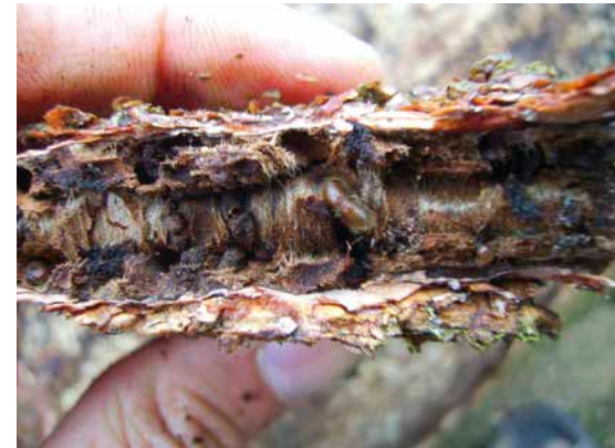
3 Buchdrucker in einem abgefallenen Rindenstück: Die Käfer haben sich in die Rindenzwischenschichten zurückgezogen.

Mit dem Schwärmflug der Fichtenborkenkäfer im April 2021 sollte aus diesen Gründen die Bohrmehlsuche prioritär an den Käfernestern aus 2020 begonnen werden, auch wenn diese schon sauber aufgearbeitet wurden. Gleiches gilt für die Bohrmehlsuche rund um die Holzlagerplätze aus dem Vorjahr.