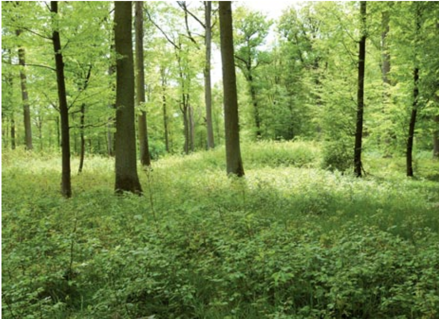
Abbildung 3: Gelungene Eichennatur- verjüngung im Forstbetrieb Arnstein (BaySF)