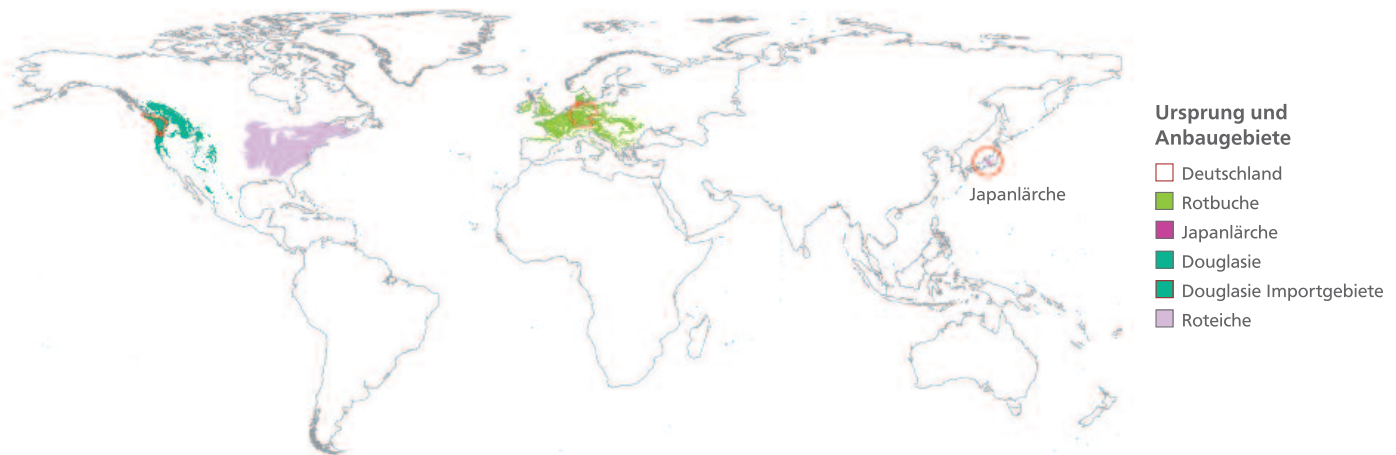
Abbildung 2: Ursprungsgebiete der nichtheimischen Baumarten Japanlärche, Douglasie und Roteiche; Arealgeometrien aus Little 1971, Hoshi und Hasebe 2004, Importgebiet der Grünen Küstendouglasie (Ruetz 1981), Areal der Rotbuche (Bohn et al. 2003) und Grenzen der BRD