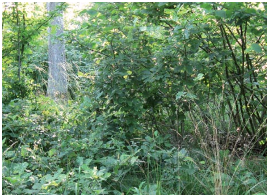
Abbildung 3: Eichenstockausschläge und Eichenkeimwüchse müssen rechtzeitig, spätestens zu Beginn der Dickungsphase von schnellwüchsigen Bedrängern wie Hasel ( Corylus avellana ) entlastet werden. Andernfalls werden sie ausgedunkelt (siehe Abbildung 1)

Das Holz der Mittelwaldeiche ist meist grobjährig (Jahringbreiten 3 bis 5 mm), dabei sehr hart und im Kern dauerhaft. Es ist vielseitig einsetzbar und hat schon immer hohe Nachfrage erfahren. Frühere Verwendungen waren z. B. Fundamente aus Eichenholzpfählen, Brücken, Mühlräder, Naben und Speichen, Fachwerk, Glockenstühle, Rebpfähle, Werkzeugstiele oder Leitersprossen. Bis heute ist Eichenholz für