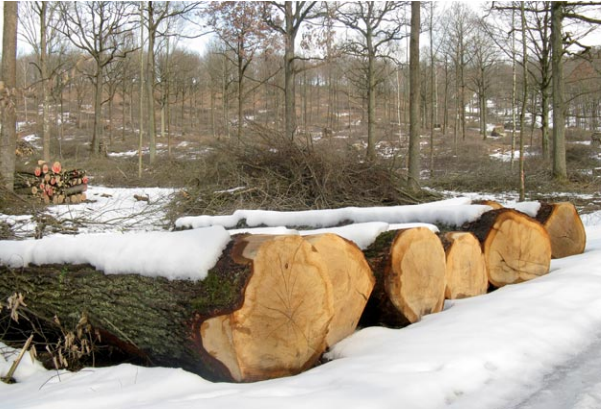
Abbildung 4: Frische Schlagfläche mit Eichen-Stammholz, Brennholz und Reisig im Betriebsverband Weigenheim