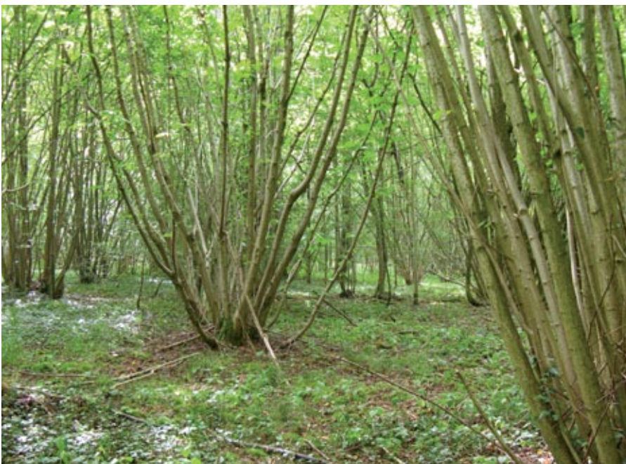
Abbildung 1: Haselbüsche ( Corylus avellana ) können eine schattige Umfütterung der Oberholzstämme bilden, sollten aber im Unterholz nicht dominieren, sonst verarmt der Mittelwald (vgl. Rebel 1922)