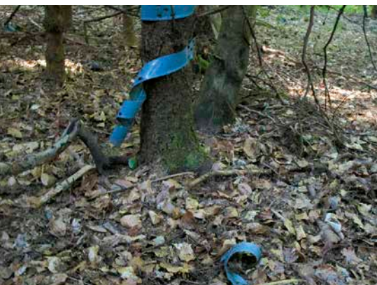
2 Diese Fegeschutzhülle hätte schon vor Jahren als Kunststoffmüll entsorgt werden müssen.

Das Bäumchen in der Hülle kann bereits bei einer Wuchshöhe von 1,5–2 m der Konkurrenzvegetation und dem Wildverbiss entwachsen sein. Da es aber im Treibhausklima der Hülle und dort vor Wind geschützt aufwuchs, hat es sich noch nicht stabilisiert. Baut man die Hülle nun bereits ab, so droht es, ohne deren stützende Wirkung umzukippen. Daher