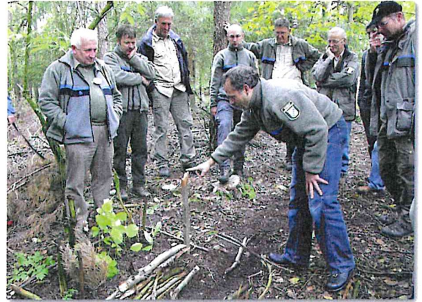
Abbildung 2: Bildungsbeauftragte der Forstverwaltung testen die Aktivität „Ich sehe was, was du nicht siehst“ und diskutieren unterschiedliche Waldnutzungskonzepte

zahlreiche Zielbereiche (zum Beispiel Nr. 3: Gesundheit; Nr. 6: Wasser; Nr. 7: Energie, Nr. 12 Konsum/Produktion, Nr. 13: Klima; 15: Biodiversität), zu denen sich die Forstwirtschaft einbringen könnte und sollte.