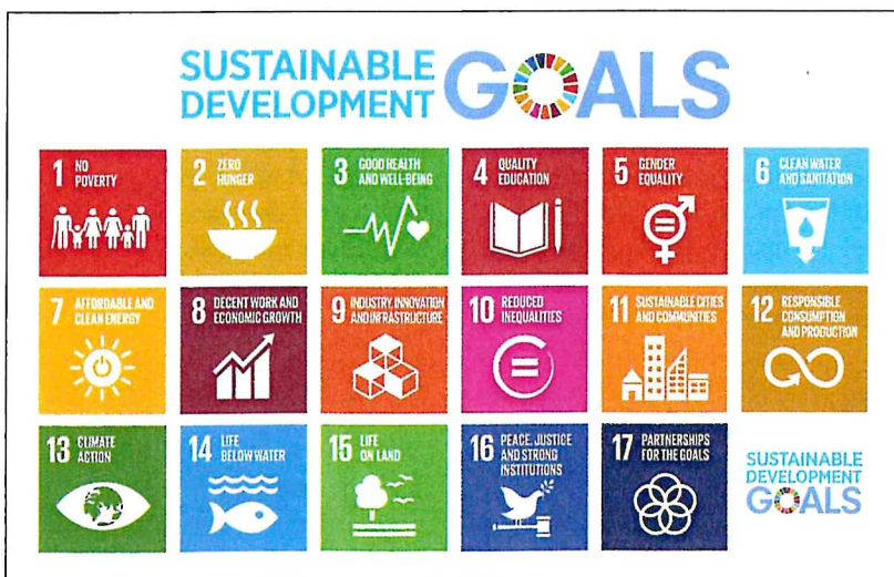
Abbildung 3: Übersicht der 17 Ziele für Nachhaltige Entwicklung („SDGs“ = Sustainable Development Goals) im Weltaktionsprogramm (WAP) zur BNE der Vereinten Nationen

Darüber hinaus kann Waldpädagogik auch Verbindungen zu derzeit in unserer Gesellschaft besonders dringlichen Themen wie „Migration“, „Gesundheit“ oder „Bildung“ herstellen. Auch wenn das auf den ersten Blick vielleicht nicht „unsere“ forstlichen Themen sind – es lassen sich durchaus Verbindungen zum Wald und zu seiner Nutzung knüpfen sowie passende Bildungsangebote entwickeln, um an einem Dialog zu diesen Themen mitzuwirken.