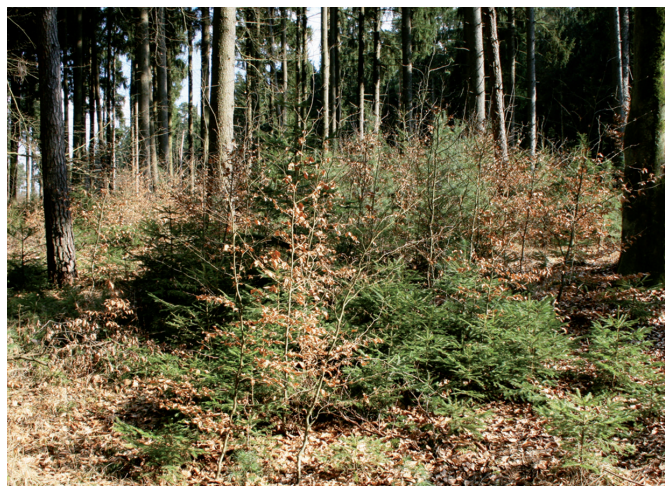
Naturnah und standortsgemäße Verjüngung für den Wald von morgen

Um die Wälder im Wesentlichen ohne Schutzmaßnahmen möglichst naturnah und standortsgemäß zu verjüngen, ist eine gute Zusammenarbeit zwischen Waldbesitzern, Jagdgenossenschaften und Jägern notwendig. Die Anlage von Weiserflächen und ihre Einbeziehung in regelmäßige gemeinsame Revierbegänge sind hervorragend geeignet, die Zusammenarbeit auf Revierebene zu stärken. Die Ergebnisse der Weiserflächen müssen für alle Beteiligten transparent und nachvollziehbar sein.