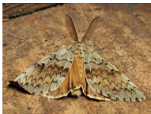
Schwammspinner: Weibchen (li.), Männchen (re.)