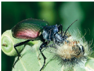
Ein Großer Puppenräuber hat eine Schwammspinnerraupe erbeutet.