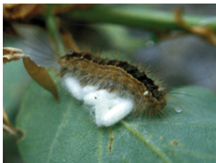
Von Brackwespen parasitierte tote Schwammspinnerraupe