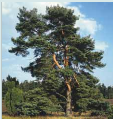
Waldkiefer: Baum des Jahres 2007