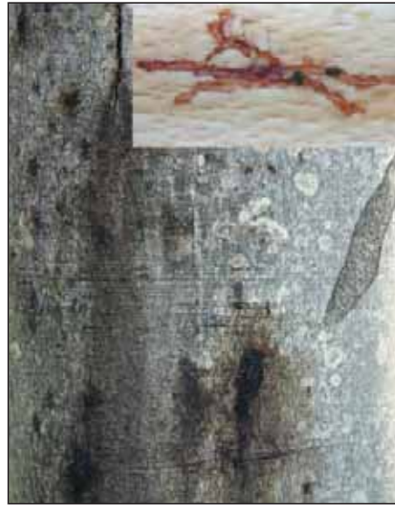
Abb. 2: Schleimflussflecken, verursacht durch Einbohrungen des Kleinen Buchenborkenkäfers; rechts oben das Brutbild mit den sternförmigen Muttergängen

Großer Lärchenborkenkäfer: Die Witterung im Jahr 2003 begünstigte bayernweit einen vermehrten Borkenkäferbefall an Lärche durch den Großen Lärchenborkenkäfer ( Ips cembrae ), der dem Buchdrucker äußerlich und in seiner Lebensweise und der Anlage der Brutbilder sehr ähnlich ist. An durch Trockenschäden geschwächten Lärchen kam es lokal zu erheblichen Stehendbefall, der auch auf vitale Bäume