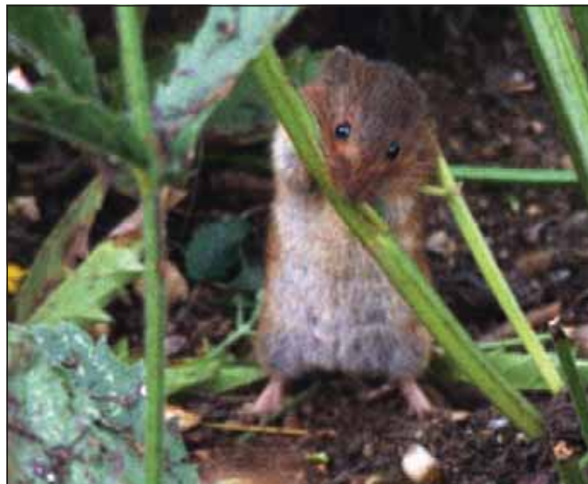
Abb. 3: Feldmaus; die durch Erd-, Feld- und Rötelmäuse verursachten bestandsbedrohenden Flächen haben sich gegenüber 2005 vervierfacht.

Schwammspinner ( Lymantria dispar ): In den Jahren 2004 und 2005 mussten in Unter- und Mittelfranken auf insgesamt 7.500 ha Bekämpfungsaktionen mit dem Häutungshemmer DIMILIN gegen Schwammspinner und Eichenprozessionsspinner (Anteil 600 ha) durchgeführt werden. 2006 war kein Fraß durch Schwammspinner festzustellen. Im Juli/August 2006 wurde eine Pheromonprognose in allen potenziell gefährdeten Gebieten durchgeführt. In keinem Bereich wurden die kritischen Anflugzahlen auch nur annähernd erreicht. Die Ergebnisse der Pheromonprognose werden im Frühjahr 2007 gegebenenfalls noch durch Eigelegesuchen abgesichert.