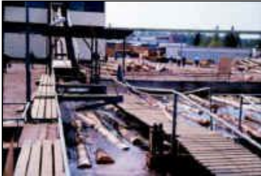
Abb. 3: Wasserlagerung des Birkenholzes macht eine weitere Vorbehandlung (Dämpfen) vor dem Schälen überflüssig, Firma Isku in Lathi/Finnland

Fachleute fällen Birken im Winter und führen sie einer möglichst schnellen Aufarbeitung noch vor der warmen Jahreszeit zu. Ist die Birke erst einmal gefällt, erfordert sie als Rund-, aber auch als Schnittholz die sorgfältigste Pflege. Dies gebietet die soeben genannte geringe Resistenz gegen Pilze und Insekten, aber auch ihre starke Neigung zum Reißen und Verwerfen.