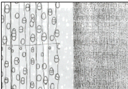
Abb. 2: Die Zerstreutporen der Birke

Sowohl die Gefäße als auch die Holzstrahlen sind auch unter der Lupe fast nicht erkennbar. Die Birken zählen zu den Zerstreutporern; die abgeplatteten Poren bzw. Gefäße sind einzeln, paarig und in kurzen, radialen Gruppen zu 2 bis 4 angeordnet, wie man in Abbildung 2 deutlich erkennen kann. Die Porengröße wird von WAGENFÜHR mit 30, 90 und 130 \mu\text{m} klein benannt und von GOTTWALD mit "fein bis mittelgroß" und den Zahlen >70 (Birnbäum) und <140 (Makore) angegeben. Auch GROSSER nennt die Gefäße "klein bis mittelgroß", die auf nicht sauber geschnittenen Hirnschnitten als helle Punkte erkennbar sind und dort den Eindruck erzeugen, man habe das Holz mit Mehl bestäubt.