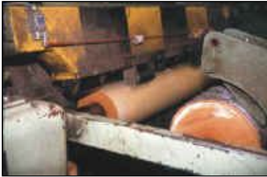
Abb. 4: Herstellung von Schäl furnieren aus finnischer Birke, Firma Isku in Lathi/Finnland

Die maschinelle und manuelle Bearbeitung wird von allen Autoren als gut bis sehr gut beschrieben. Schnittgeschwindigkeiten zwischen 28 und 33 m/sec und gut gepflegte Werkzeugschneiden erzielen saubere Flächen. Besonders gut eignet sich Birkenholz zum Schälen, aber auch das Messern, Hobeln, Fräsen, Profilieren, Drechseln und Schnitzen ist leicht und mit glatten Oberflächenergebnissen durchzuführen. Einer anschließenden Oberflächenbehandlung durch Beizen, Lackieren und Polieren steht nichts im Wege, sieht man von gelegentlichen Schwierigkeiten bei Polyesterlackierungen ab. Das Nagel- und Schraubenthaltevermögen ist gut. Besonders ist die gute Biegefähigkeit hervorzuheben, die unserer Rotbuche in keiner Weise nachsteht.