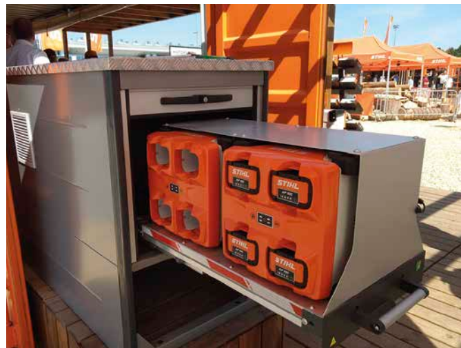
5 Akku-Transport- und Ladebox »bottTainer«

Stihl präsentierte zudem die neue Akkusäge »MSA 300«. In Kombination mit dem Akku AP500S ist sie die derzeit stärkste Akkusäge auf dem Markt. Ihre Leistung soll im Bereich der klassischen Stihl MS-261 Benzinmotorsäge liegen.