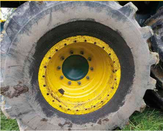
6 HSM-Beadlock Felge