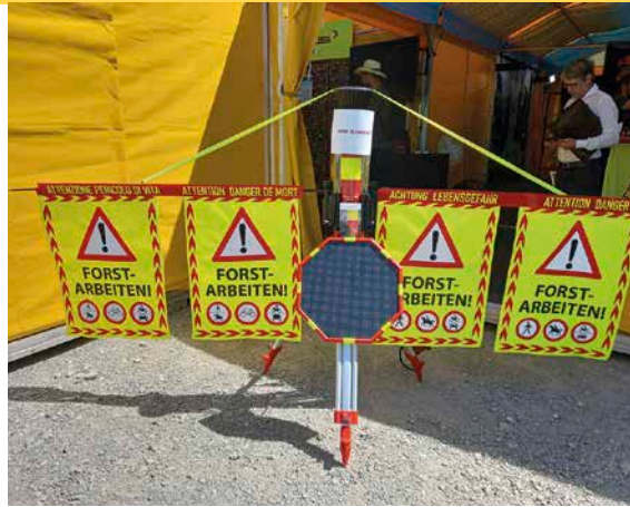
7 Die »interaktive« Straßensperre PROTOS® Barrier mit integrierter Kamera

Bei der zweiten Ausführung ist der Reifen auf der Felge festgeklemmt, beim dritten Modell wird das Durchrutschen des Reifens auf der Felge durch eine spezielle Riffelung (»Super Knurling«) auf der Felgeninnenseite verhindert.