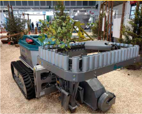
2 Pflanzaggregat für Containerpflanzen am Pflanzelt »Moritz«

Kunststoffseil der Hilfsseilwinde wird mittels einer leichten Umlenkrolle aus dem Seilkletterbereich am Ende der Seillinie angebracht. Anschließend zieht die Hilfsseilwinde das Seilwindenseil inklusive Ketten zur Last ein. Sofern in einer Seillinie mehrere Beizüge erforderlich sind, kann das Hilfsseil mit der Last zur Seilwinde gezogen werden und steht somit umgehend zum erneuten Auszug des Seilwindenseils zur Verfügung. Der Vorteil dieses Systems besteht darin, dass lediglich das relativ leichte Kunststoffseil mit rund 1,2 kg/100 lfm von Hand zur Last gezogen werden muss – herkömmliche Stahlseile wiegen zwischen 50 und 80 kg/100 lfm. Vor allem in steilem Gelände ist dies gerade beim »Bergabseilen« eine erhebliche Arbeitserleichterung.