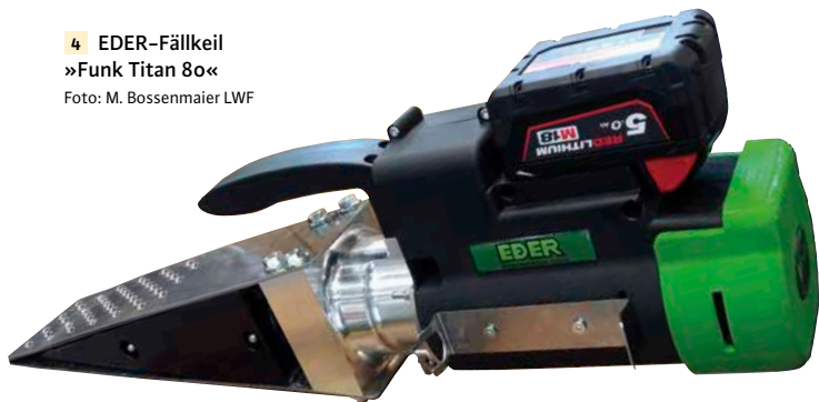
4 EDER-Fällkeil »Funk Titan 80«

sich unabhängig vom Wasserwerfer weitere Brände bekämpfen oder gefährdete Bereiche besprühen lassen. Wird die Brandbekämpfungseinheit vor Ort nicht mehr benötigt, kann sie relativ schnell abgenommen werden. Der Forwarder steht somit wieder uneingeschränkt für seine eigentliche Aufgabe zur Verfügung. Die abgebaute Brandbekämpfungseinheit mit einem Leergewicht von 1,5 t ist dann zeitnah an einem anderen Ort, auf einer anderen Maschine montiert, einsatzbereit.