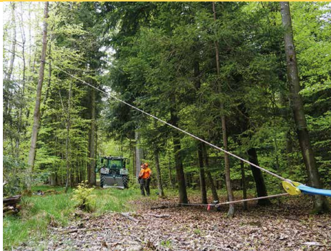
3 Seilwindenunterstützte Fällung: Beim »umgelenkten Zug« wird der Baum vom Schlepper weggezogen.

Unter Umständen stößt die Harvester-technik im Laubstarkholz oder bei unzugänglichem Gelände an ihre Grenzen, oder es ist keine Maschine für spezielle Einsätze verfügbar. In diesen Fällen kann die Forstseilwinde die Lösung sein. In den letzten Jahren wurden verschiedene Hilfsmittel und Arbeitstechniken für die seilwindenunterstützte Fällung (Abbildung 3) entwickelt. Bei fachlich richtiger Anwendung ist eine sichere Fällung auch bei abgestorbenen Laubbäumen grundsätzlich möglich. Gleiches gilt für die technischen Lösungen bei den fernbedienbaren mechanischen und hydraulischen Keilen (Abbildungen 5 und 6). Ob