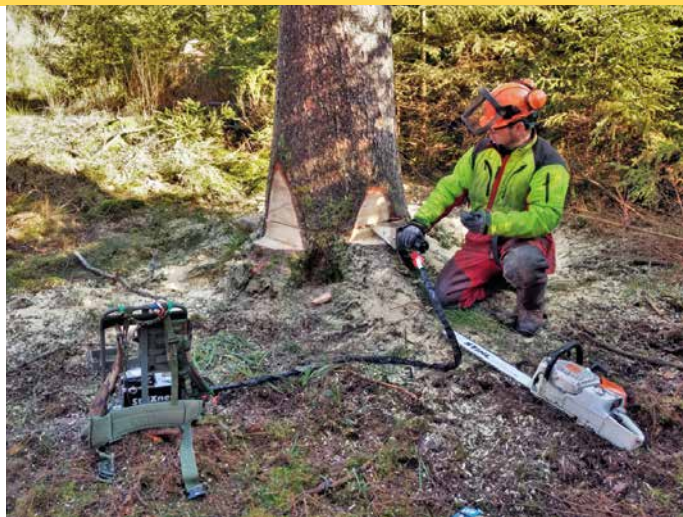
6 Fernbedienbarer hydraulischer Fällkeil

»TOP« wird es nur, wenn man neben dem technischen Arbeitsverfahren auch den Arbeitsablauf durchdenkt. Grundlage ist immer die Baumbeurteilung am Einzelbaum!