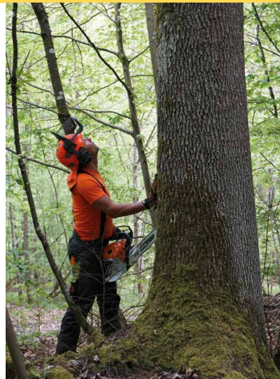
1 Eine gewissenhafte Baumannsprache ist das A und O vor jeder Baumfällung. Dazu muss der Waldarbeiter/die Waldarbeiterin unter anderem Neigung und Umgebung des Baumes genau prüfen, mögliche Gefährdungen wie Totholz und Fäule beurteilen, das geeignete Arbeitsverfahren wählen und die beste Fällrichtung planen.

Zu Beginn muss geklärt werden, ob der geschädigte oder abgestorbene Baum tatsächlich gefällt werden muss. Bei einer