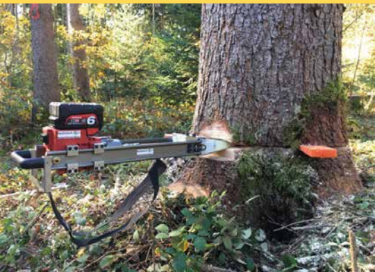
5 Mechanischer Fällkeil im Schnabelschnitt