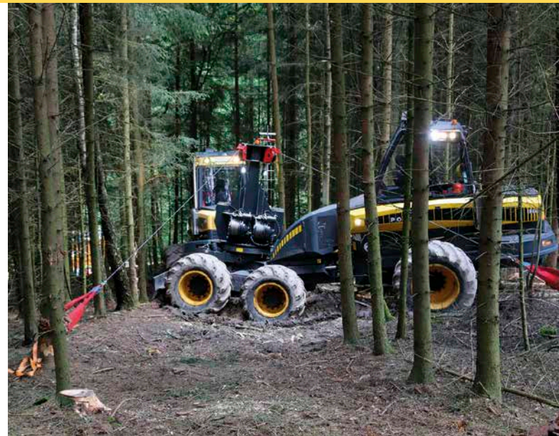
10 Die externe Traktionshilfswinde Synchronwinch MW 500 der Herzog Forsttechnik AG verfolgt einen neuen Ansatz: Winde und Trägerfahrzeug werden per Funk vom Fahrer des zweiten Fahrzeugs gesteuert.

denziell zugenommen und bewegen sich derzeit bei etwa 400 m. Die Zugkraft der Winden liegt meist in einem Bereich von 70 bis 150 kN. Die technische Umsetzung erfolgt als Trommel- oder Spillwinde in Verbindung mit einem oft separat angebrachten Seilspeicher. Beide Systeme sind am Markt etabliert.