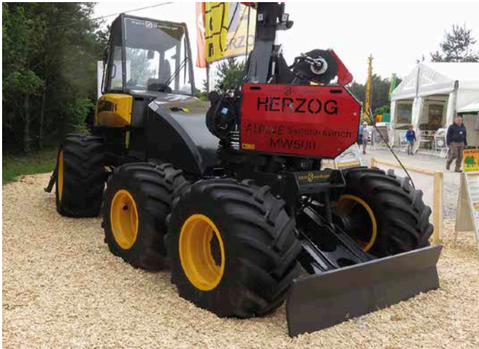
9 Herzog Synchronwinch MW 500 auf der KWF-Tagung 2016 in Roding.