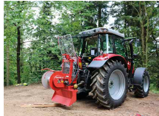
2 Die 3-Punkt-Anbau-Seilwinde mit dosierbarer Bremse