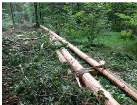
4 Das Arbeitsergebnis des entrindenden Harvesteraggregates