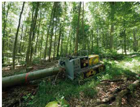
7 Das breite Raupenfahrwerk ermöglicht die bodenschonende Befahrung wasserbeeinflusster Weichböden.

Der Landesbetrieb Forst Baden-Württemberg kombiniert Rückeraupen mit der Seilkranbringung auf empfindlichen Weichböden und in Hanglagen bis zu einer Steigung von 50%. Neben der Seilunterstützung bei der Fällung der Bäume wird auch das Vorkonzentrieren zur Seiltrasse mithilfe der Forstraupen erledigt. Die Rückung zur Forststraße und die anschließende Aufarbeitung erfolgt zeitlich versetzt durch einen Gebirgharvester. Vorrückeraupen überzeugen darüber hinaus durch ihren einfachen und schnellen Transport im gängigen PKW-Anhänger und eignen sich daher besonders zur Unterstützung von Verkehrssicherungshieben.