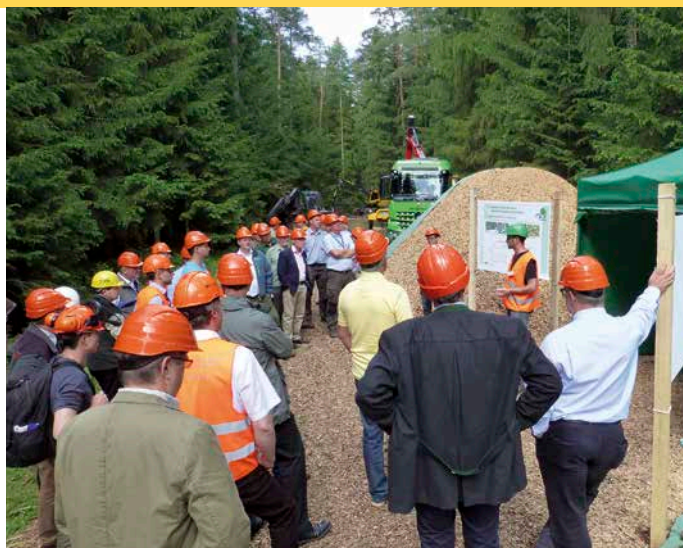
5 Aufwendig in der Vorbereitung, dafür aber imposant: die Hackschnitzelmieten. Die Besucher konnten auf einem Bildschirm im Pavillon live die Temperaturentwicklung in den Mieten verfolgen.

Die Hochschule Weihenstephan-Triesdorf (HSWT) stellte zusammen mit dem Kuratorium für Waldarbeit und Forsttechnik e.V. das Projekt »Debarking Head« vor. Solche entrindenden Harvesterköpfe (Ab-