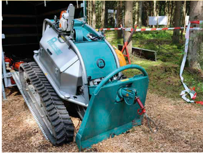
6 Die brandneue 1,4 Tonnen leichte Fäll- raupen der Firma Pfanzelt

Die an der KWF-Tagung vorgestellten Fäll- und Rückeraupen der Firmen Pfanzelt, HSM und Wicki Forst erfreuen sich zunehmenden Interesses. Bei Gassenabständen größer 30 m entstehen bei der vollmechanisierten Holzern in der Regel Zwischenbereiche, die außerhalb der Kranreichweite der Harvester und Forwarder liegen. Im vorgestellten Arbeitsverfahren des Landesbetriebes Forst Brandenburg werden die Bäume der Zwischenzone motormanuell gefällt und anschließend mit einer funkgesteuerten Raupen an die Rückegasse vorgeführt. Die Forstraupen rückt die Sortimente mittels integrierter Seilwinde zur Rückegasse. Das an der Front befindliche Rückeschild der circa 1,4–2,8 t leichten Raupenfahrzeuge erzeugt die benötigte Standfestigkeit. Durch das Raupenfahrwerk, das geringe Gewicht und den niedrigen Schwerpunkt sind Vorrückeraupen auch auf befahrungsempfindlichen Standorten und in schwierig zu erschließenden Hanglagen einsetzbar. Die bodenschonenden Forstraupen eignen sich darüber hinaus für die seilunterstützte Fällung von Starkholz und stellen damit eine vielseitig verwendbare Alternative zu den gängigen Seilwindenschleppern dar.