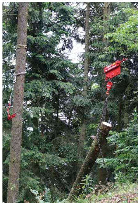
1 Kleinseilbahn: Der Hubrollenlaufwagen bewegt sich über das gespannte Tragseil. Eine Anhängelast von bis zu 1.000 kg ist möglich.

denen Stationen des Exkursionspunktes konnten sich die Besucher ein umfangreiches Bild über die eingesetzte Technik, den Aufbau und den Arbeitsablauf der Kleinseilbahn machen. Die Seilkrananlage besteht vor allem durch ihre einfache Technik und ihre geringen Anschaffungskosten. Als Antrieb für die 3-Punkt-Anbau-Seilwinde mit dosierbarer Bremsenrichtung ist lediglich ein kleiner Standardschlepper erforderlich (Abbildung 2). Die Bergaufbringung erfolgt im klassischen Zweiseilbetrieb. Das Tragseil ist dabei in gestreckter Linie zwischen zwei Endmastbäumen gespannt. Das Zugseil der