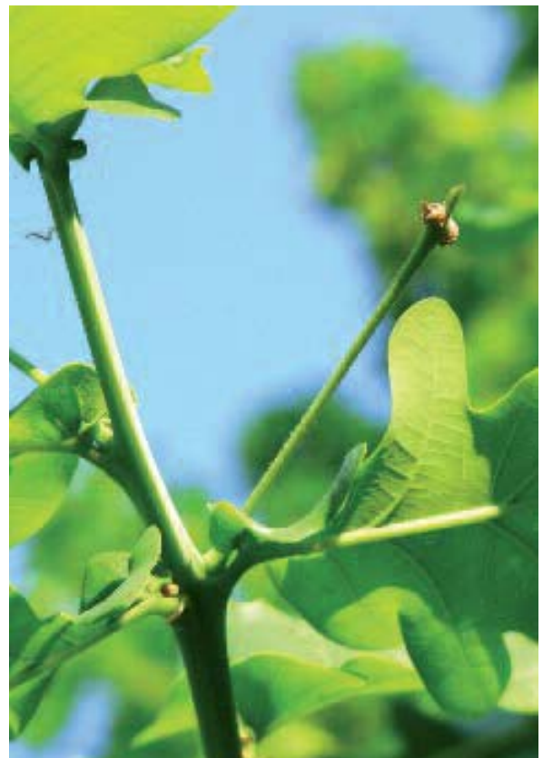
Abbildung 1: Blätter und Früchte (oben) sowie weibliche Blüten (unten) der Trauben- (links) und Stieleiche (rechts).