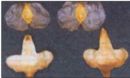
Abb. 2: Nussfrüchte (untere Reihe) und Fruchtschuppen der Hängebirke.

ohnehin erst im folgenden Frühjahr. Licht ist für die Keimung zwar nicht immer unbedingt notwendig, aber doch zumindest förderlich. Die Keimfähigkeit liegt bei großen Schwankungen von Baum zu Baum [STÖLTING 1990] im Mittel nur bei etwa 10 bis 30% (z.B. FREHNER und FÜRST 1992) und verringert sich unter natürlichen Bedingungen rasch. Die Samen enthalten kein Nährgewebe (Endosperm). Der zunächst nur wenige Millimeter große und sehr zarte Keimling muss deshalb bereits unmittelbar nach der Keimung durch Photosynthese seinen kompletten Stoff- und Energiehaushalt alleine decken. Voraussetzung hierfür ist genug Licht sowie das unverzügliche Eindringen der Keimwurzel in den Mineralboden. Sind diese Bedingungen erfüllt, kann der Sämling rasch wachsen und innerhalb weniger Wochen Höhen von 10 cm und mehr erreichen. Die Verjüngung auf freien Fläche erfordert eine hohe Frosthärte. Im Vergleich zu den meisten anderen einheimischen Baumarten erträgt die Hängebirke (und in noch stärkerem Ausmaß die Moorbirke) im Winter Temperaturen bis unter -40^{\circ}\text{C} : Selbst in der Vegetationszeit überstehen junge Birkenprossen Frost bis -5^{\circ}\text{C} schadlos.