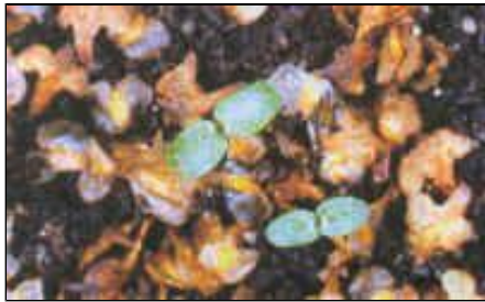
Abb. 3: Keimlinge unmittelbar nach Entfaltung der Keimblätter.