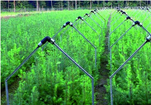
Abbildung 4: Überwinterung der Douglasie am Pflanzgartenstützpunkt Bindlach bei Bayreuth