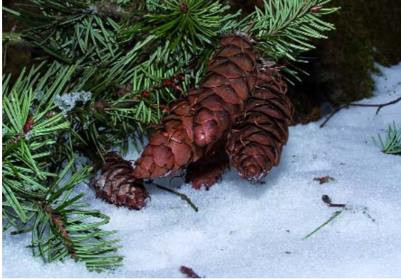
Abbildung 3: Zapfen der Grünen Douglasie

Die Samen der Douglasie können bei -20^{\circ}\text{C} und zehn Prozent Wassergehalt weit über zehn Jahre lang ohne Keimverlust gelagert werden.