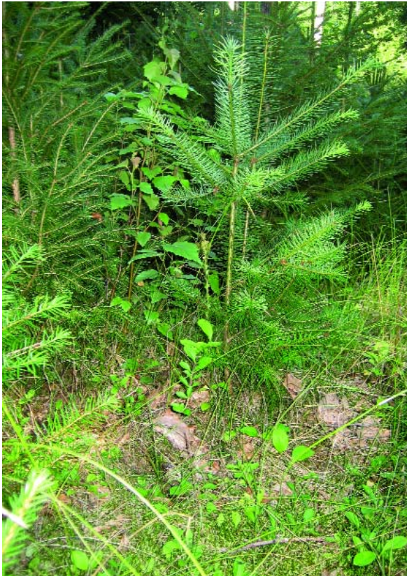
Abbildung 1: Junge Douglasie