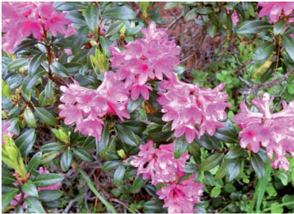
Abbildung 3: Rostblättrige Alpenrose in einem durch Weide geprägten hochsubalpinen Silikat-Lärchen-Zirbenwald im Unterengadin

Strauch- und Bodenvegetation Säurezeiger neben Kalkzeigern zu finden sind. Gemeinsam mit der säurezeigenden Rostblättrigen Alpenrose (Abbildung 3) kommen auch Kalkzeiger wie die Bewimperte Alpenrose ( Rhododendron hirsutum ), die Zwergalpenrose ( Rhodothamnus chamaecistus ) und das Blaugras ( Sesleria albicans ) vor. Außerdem ist eine stark entwickelte Moosschicht typisch für diese Waldgesellschaft. Walentowski et al. (2006) unterteilen für Bayern die Bodenvegetation nochmals anhand ihres unterschiedlichen Standortes. Auf mächtigen Tangelhumusböden kommen verstärkt die Säurezeiger der Rentierflechten-, Beerstrauch- und Rippenfarngruppe vor. Auf lehmreicheren Standorten sind vermehrt Grünerle ( Alnus viridis ), Schluchtweide ( Salix appendiculata ) und Arten der Pestwurzgruppe ( Petasites ) zu finden.