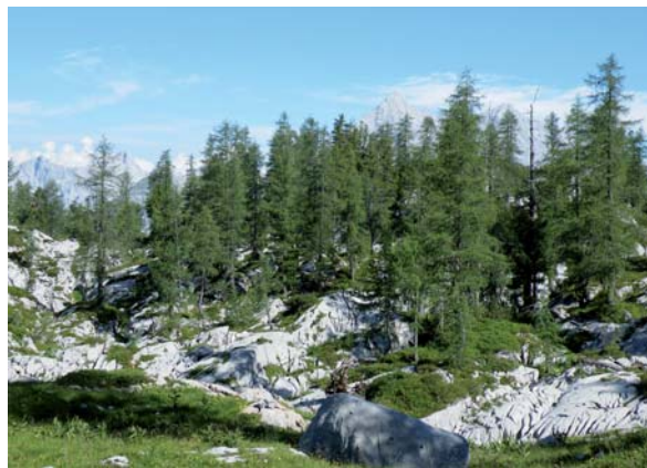
Abbildung 2: Der Karbonat-Lärchen-Zirbenwald stockt auf einem flachen Karstplateau in den Berchtesgadener Alpen. Die Zirbe ist dominierend; im Unterwuchs Vaccinium -Arten.

In den Bayerischen Alpen ist die Lärche selten als natürliche Schlusswaldbaumart vorzufinden. Nur an der Waldgrenze Alpen einwärts gelegener, kontinentaler getönter Bergketten dominiert sie gemeinsam mit der Zirbe. In Deutschland gibt es nennenswerte Vorkommen dieser als Karbonat-Lärchen-Zirbenwälder ( Vaccinio-Pinetum rhododendretosum hirsuti , nach Mayer 1974) beschriebenen Waldgesellschaft (Walentowski et al. 2006) nur in den Berchtesgadener Alpen (Abbildung 2). Sehr kleinflächige und isolierte Vorkommen sind im Mangfallgebirge, in den Chiemgauer Alpen, in den Allgäuer Hochalpen, im Karwendel und im Wettersteinmassiv zu finden.