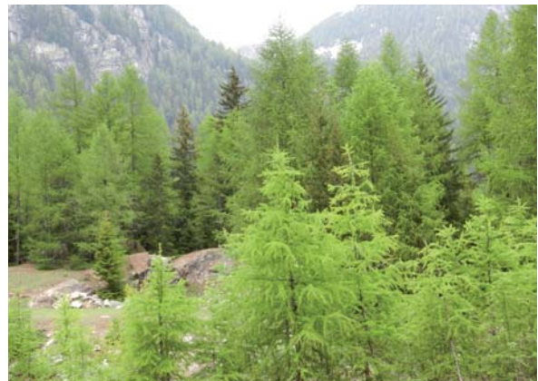
Abbildung 1: Pionierphase des tiefsubalpinen Fichten-Lärchen-Zirbenwaldes mit dominierender Lärche im Martelltal, Südtirol

Das kontinentale Extremklima der Zentralalpen mit sehr frostigen, schneearmen Wintern und warmen, strahlungsintensiven und trockenen Sommern behagt der Lärche mehr als anderen Baumarten, wodurch sie einen Konkurrenzvorsprung hat. Auf silikatischem Ausgangsgestein der hochsubalpinen Stufe vergesellschaftet sie sich mit der Zirbe, in tieferen Lagen kommt die Fichte hinzu (Klosterhuber et al. 2011) (Abbildung 1).