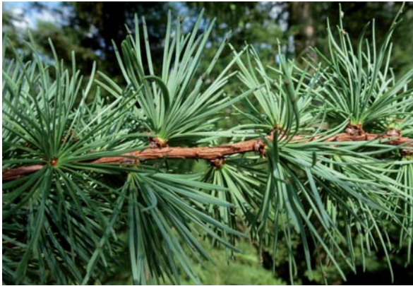
Abbildung 9: Spross mit Kurztrieben der Japanischen Lärche; die junge Rinde ist im Unterschied zur Europäischen Lärche rotbraun.