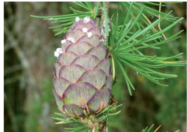
Abbildung 7: Zapfen von Larix decidua vor der Samenreife

Neben der Europäischen Lärche wird in Mittel- und vor allem in Westeuropa häufig die Japanische Lärche ( Larix kaempeferi , syn. L. leptolepis , Abbildung 9 und Abbildung 10) angebaut, die 1861 nach Europa eingeführt wurde. Von Natur aus ist die Japan-Lärche ein wichtiger Waldbaum in höheren Gebirgslagen (1.100–2.700 m)