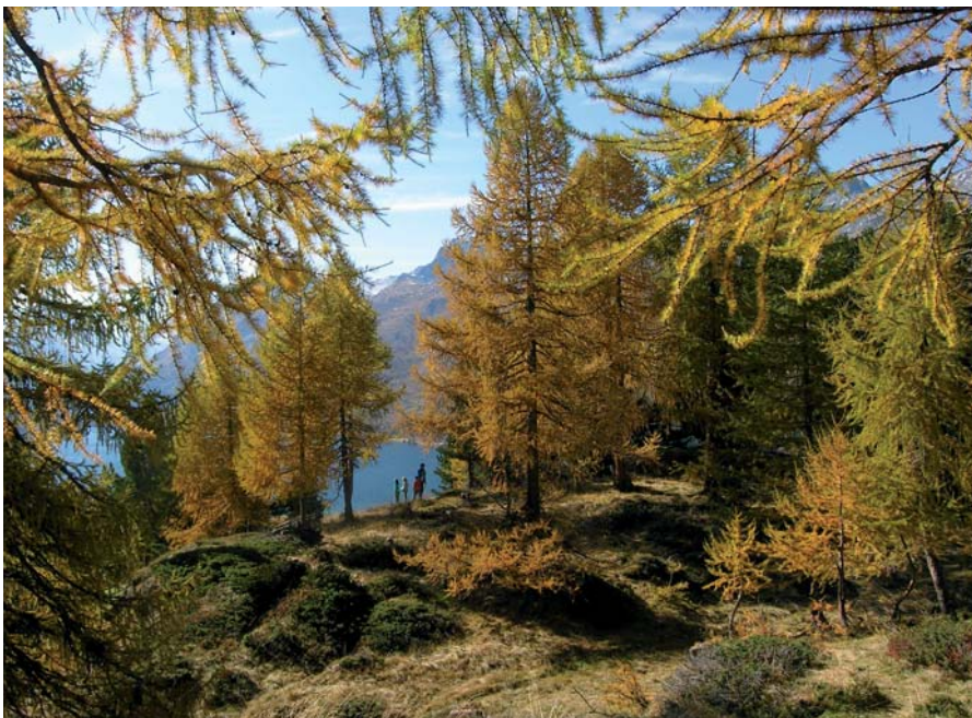
Abbildung 1: Lärchenbestand im Herbst in Sils, Graubünden

Die Europäische Lärche kommt von Natur aus in mehreren geografisch getrennten Teilarealen vor. Das größte zusammenhängende Verbreitungsgebiet sind die Alpen, wobei sie in den Westalpen nur in zentralalpinen Gebieten vorkommt (Abbildung 1), in den Ostalpen hingegen vermehrt auch in den niederschlagsreichen Randalpen bis in den Wienerwald. Isoliert vom Alpenraum gibt es im östlichen Europa Lärchenvorkommen in den West-, Ost- und Südkarpaten, in den Sudeten (Gesenke und Altvater) und in der Weichselniederung Polens.