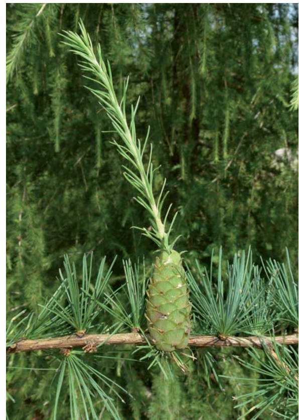
Abbildung 8: Zapfen sind Sprosse, was man daran erkennen kann, dass sie gelegentlich an ihre Spitze als benadelte Triebe weiter wachsen. In der Regel sterben diese bei der Samenreife ab.