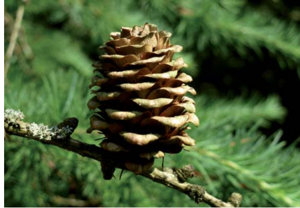
Abbildung 10: Zapfen der Japanischen Lärche; die Samenschuppen sind im Unterschied zur Europäischen Lärche nach außen umgebogen.