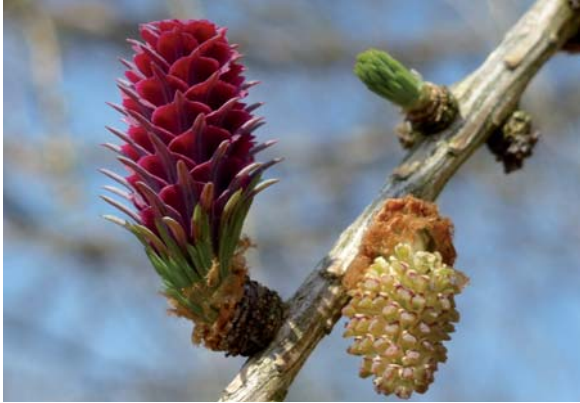
Abbildung 6: Weiblicher Blütenstand (links) und männliche Blüte von Larix decidua

knospe ab und können daraus Jahr für Jahr einen Büschel Nadeln bilden. Die Langtriebbildung ist ausgeprägt akroton (spitzenwärts) gefördert, das heißt, je näher sich ein Kurztrieb zur jeweiligen Sprossspitze befindet, um so wahrscheinlicher wird er zum Langtrieb und desto stärker ist sein Längenwachstum. So werden die Endknospen an der Spitze eines Zweiges am häufigsten zu Langtrieben, während Triebe im mittleren und basalen Teil einer Sprossachse, insbesondere im Kroneninneren, am längsten im Kurztriebstadium verharren. Langtriebe bilden sich deshalb bevorzugt an der Peripherie der Krone und im Wipfelbereich, was zu einer raschen Vergrößerung der Krone und vor allem in der Jugend zu stärkerem Höhenwachstum führt.