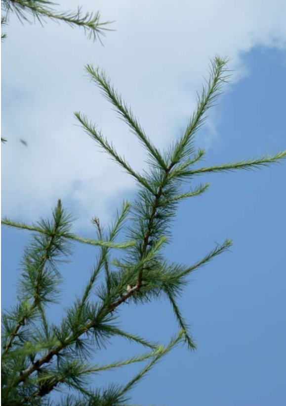
Abbildung 4: Kurz- und Langtriebe von Larix decidua ; Langtriebe werden bevorzugt an der Spitze von Zweigen gebildet.

Größere natürliche Lärchenbestände gibt es in Deutschland nur auf kleiner Fläche im hochsubalpinen Lärchen-Zirbenwald in den östlichen bayerischen Alpen (Berchtesgadener und Werdenfeller Land) (Ewald, WINALP). Außerhalb ihres Areals werden Lärchen aber in ganz Mitteleuropa forstlich angebaut. In Deutschland beträgt ihr Anteil (inklusive der Japanischen Lärche) an der gesamten Waldfläche 2,8% (Bundeswaldinventur 2002). In Bayern ist die waldbauliche Bedeutung der Lärche mit einem Flächenanteil von 2,0% geringer als in den meisten anderen Bundesländern (z. B. Schleswig-Holstein 7,6%, Hessen 4,8%, Niedersachsen 4,7%).