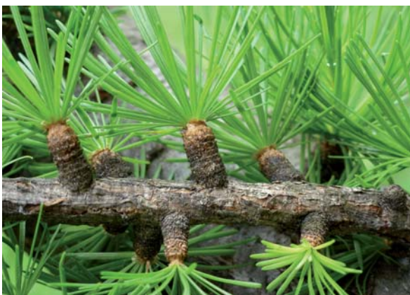
Abbildung 3: Ältere Kurztriebe von Larix decidua

Das stark disjunkte Areal hat zur Ausbildung geografischer Rassen geführt, die sich in morphologischen und ökophysiologischen Merkmalen unterscheiden (z. B. Wüchsigkeit, Wuchsform, Anfälligkeit gegenüber Krankheiten). Früher hat man diese Klimarassen als die Unterarten Alpenlärche ( L. decidua ssp. decidua ), Sudetenlärche (ssp. sudetica ), Karpatenlärche (ssp. carpatica ) und Polenlärche (ssp. polonica ) unterschieden. Nach neuerer Auffassung (Farjon 2010) unterteilt man die Art nur noch in die drei Varietäten L. decidua var. decidua , var. carpatica und var. polonica .