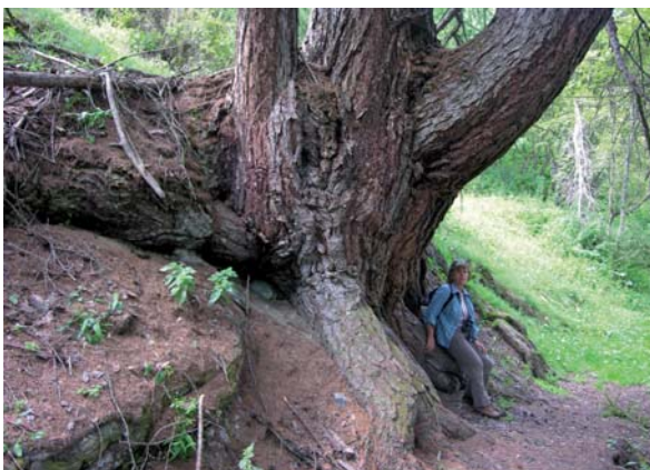
Abbildung 2: Alte und mächtige, mehrstämmige Lärche in Lavin, Graubünden