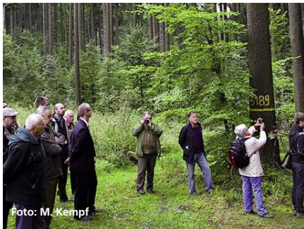
Foto: Fichtenerntebestand in den Beskiden

Die Gründung der IUFRO (Internationale Organisation forstlicher Versuchsanstalten) vor etwa 100 Jahren in Waldsiedersdorf ist eng mit der Herkunftsforschung verbunden. Gemeinsame Herkunftsversuche wa-