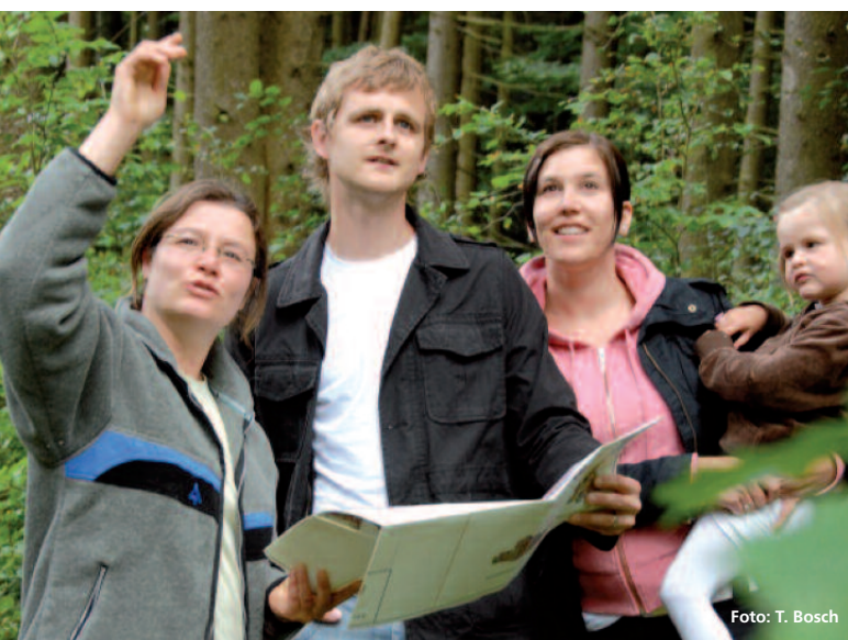
Abbildung 1: Ein wesentliches Ziel der neuen Beratungshilfen: »Die Menschen da abholen, wo sie stehen«. Der Berater muss es verstehen, auf sein Gegenüber einzugehen und ihn mit geeigneten Informationen und Argumenten zu motivieren.

Die Beratung der Privatwaldbesitzer zählt zu den Kernaufgaben der Bayerischen Forstverwaltung und hat in der Verwaltung einen sehr hohen Stellenwert. Es war daher an der Zeit, die alten Lehr- und Beratungshilfen aus der Zeit der Bayerischen Staatsforstverwaltung zu »modernisieren« und neu aufzulegen. Ein Expertenteam aus Wissenschaft und Praxis hat sich intensiv mit diesen Beratungsunterlagen befasst. Zum Ende dieses Jahres werden die Beratungshilfen grundlegend neu überarbeitet den Beratungsförstern zur Verfügung stehen.