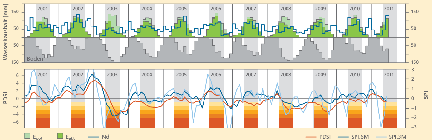
Abbildung 2: (oben) Wasserhaushaltsparameter für die Berechnung des PDSI, (unten) PDSI und SPI auf 3- und 6-Monats-Basis dargestellt für die DWD-Station Regensburg im Zeitraum 2001 – 2011. E_{pot} = potentielle Evapotranspiration, E_{akt} = aktuelle Evapotranspiration, Nd = Niederschlag, Boden = nutzbare Wasserkapazität des Bodens (Sättigung bei 150 mm angenommen). PDSI = Palmer Dürre Index, SPI.6M bzw. SPI.3M standardisierter Niederschlags-Index auf 6 bzw. 3-Monats-Basis. Die Dürre-Indizes sind in erster Linie interessant während der Vegetationsperiode (Mai – September), die durch die grauen bzw. farbigen Balken angedeutet wird. Die Farbskala von gelb nach rot zeigt die fünf Dürrestufen nach Tabelle 1 an.

PDSI eher störend. Er ist eine hydrologische Größe, die bei landwirtschaftlicher Bewässerung in Gebieten wie z.B. dem mittleren Westen der USA eine Rolle spielt, aber nicht für die hiesige Forstwirtschaft. Hingegen ist die Pufferwirkung des Bodens ein wichtiger Aspekt, der nur im PDSI und nicht im SPI berücksichtigt wird. Auch dem Anstieg der Evapotranspiration bei steigenden Sommertemperaturen durch den Klimawandel wird nur der PDSI gerecht.