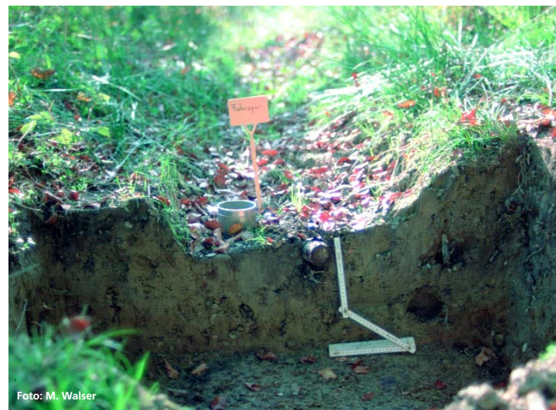
Abbildung 1: Der Spurtyp 3 weist mindestens 10 cm tiefe Fahrspuren bis in den Unterboden mit deutlich sichtbaren seitlichen Aufwölbungen auf.