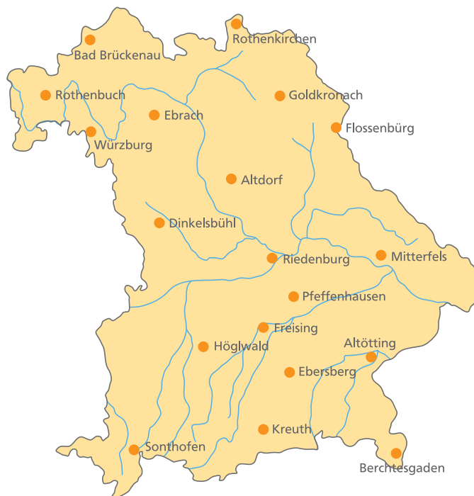
Abbildung 1: Die LWF betreibt seit 1991 die Waldklimastationen. Aktuell erfassen 19 Waldklimastationen in den wichtigsten Waldlandschaften Bayerns Umwelteinflüsse und ihre Wirkung auf den Wald.

Die WKS Ebrach liegt im Wuchsbezirk 5.2 Steigerwald auf 410 m ü. NN. Das Klima ist subatlantisch geprägt, d.h. der Temperaturunterschied zwischen Sommer und Winter ist nicht so stark wie weiter östlich (Unterschied der mittleren Monats-temperatur Juli minus Januar 1971–2000: 17,7 K). Zwar fällt der meiste Niederschlag im Sommer, aber auch im Winter gibt es ein Nebenmaximum, typisch für den atlantischen Einfluss.