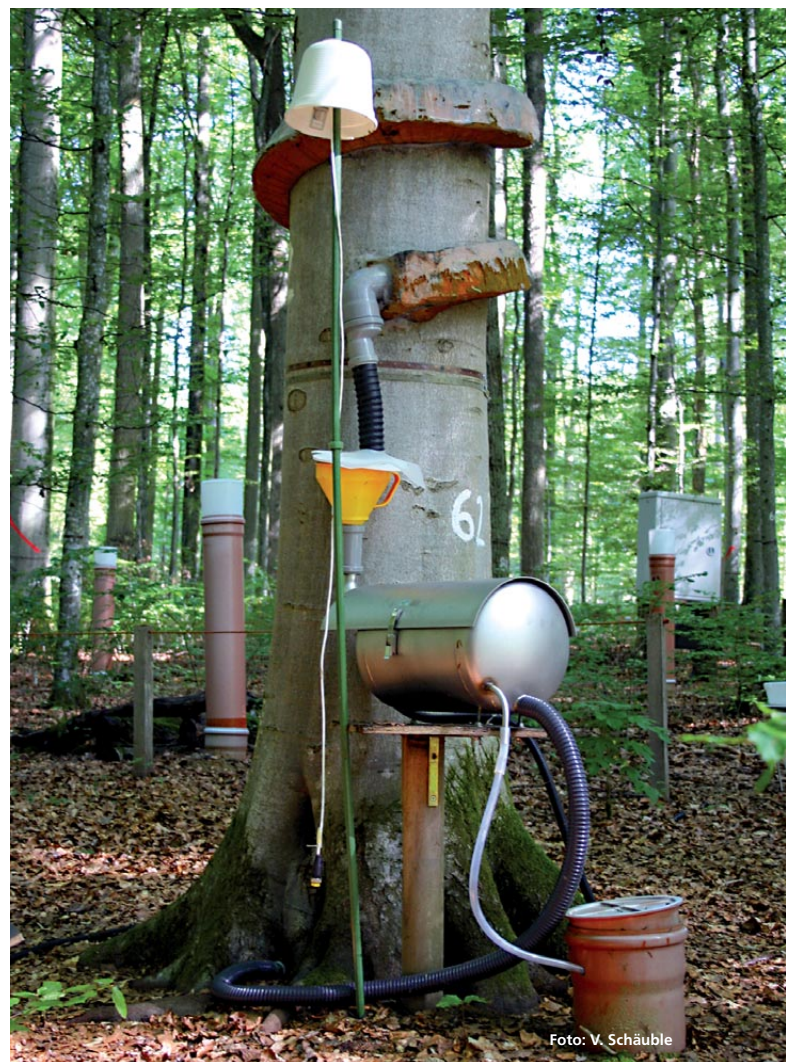
Abbildung 4: Mit einer Stammabflussschicht und mit einem Bestandesniederschlagssammler werden an den Bestandesmessstellen unter anderem die Schadstoffeinträge erfasst, so auch hier am Beispiel der Buchen-WKS in Freising.

Bei der Untersuchung des Wasserhaushalts von Buchenwäldern kommt der Erfassung des Stammabflusses besondere Bedeutung zu. Die Buche ist die Baumart, die aufgrund ihrer Kronenform und ihrer glatten Rinde über die Fähigkeit verfügt sich selbst zu gießen. Sie leitet Wasser aus dem Niederschlag so ab, dass es stammnah ihren Feinwurzeln zur Verfügung steht. Im Mittel macht der Stammabfluss rund ein Fünftel des Niederschlags aus, der über dem Kronendach ankommt. Er würde somit in den Niederschlagssammlern auf dem Waldboden fehlen, wenn man ihn nicht mit Schlauchmanschetten, die um die Buchen gebunden sind, auffängt und in eine Kippwaage leitet, die die vom Stamm abgeleitete Wassermenge misst (Abbildung 4). An der WKS Ebrach ist daher geplant, solche Stammabflussschichten, versehen mit einer Datenerfassungseinheit, 2015 zu installieren.