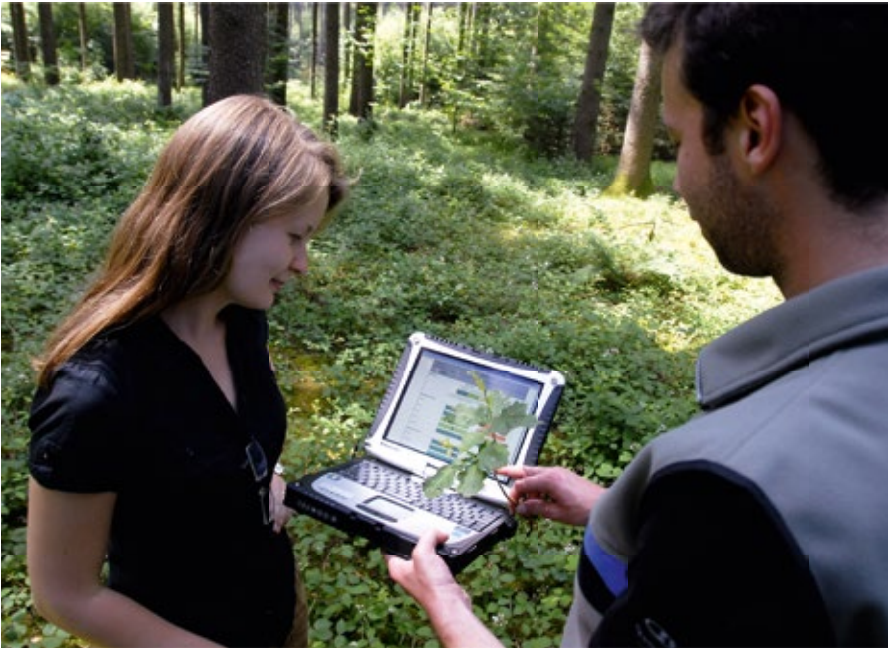
Abbildung 3: Gute Beratung ist außerordentlich wichtig. Sie hilft den Waldbesitzern, eigenverantwortlich zu entscheiden, auf welchen Standorten und in welchem Umfang sie Fichten, Buchen, Eichen und andere Baumarten am Aufbau ihrer künftigen Wälder beteiligen.