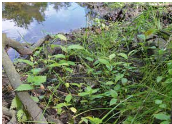
Abbildung 14: Naturverjüngung der Flutterulme am Ufer der Krückau.