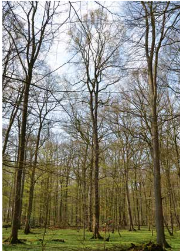
Abbildung 3: Auf geeigneten Standorten des Östlichen Hügellandes in Schleswig-Holstein erreichen Flutterulmen Höhen von über 40 m.

Trotzdem ist die Verbreitung in Schleswig-Holstein nur eine lückenhafte. Gründe dafür mögen in der Wald- und Forstgeschichte des Landes liegen. Schon mit dem Ulmenabfall im Subboreal wurde die Gattung Ulmus in ihrem Anteil, den sie dereinst in den Urwäldern des Atlantikums eingenommen hatte, erheblich reduziert. Eingetretene Arealverluste konnte sie in der Folgezeit aufgrund des Aufkommens konkurrenzstärkerer Baumarten, vor allem der Rotbuche ( Fagus sylvatica ), nicht mehr ausgleichen. Zusätzliche Arealverluste ergaben sich mit der Rodung der Auenbereiche von Fließgewässern seit dem Mittelalter. In den verbliebenen Wäldern wird die mancherorts überaus intensiv betriebene Köhlerei zu weiteren Verlusten geführt haben, zumal Ulmenholz für die Holzkohleproduktion besonders geschätzt wurde (von Carlowitz 1713; von der Schulenburg 1780). Überdies dürften in Zeiten der Waldweide, etwa bis gegen Ende des 18. Jahrhunderts, Ulmen aufgrund ihres vom Vieh besonders geschätzten Laubes (von der Schulenburg 1780; von Burgsdorf 1790; von Wickede 1820; Lenz 1867) vielleicht noch stärker als andere Arten Opfer des Verbisses geworden sein.