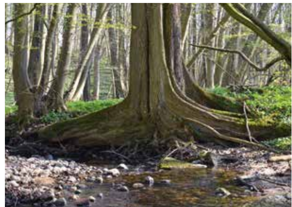
Abbildung 4: Die Brettwurzeln des Uferbaumes weisen dem kleinen Waldbach die Richtung.

1995). So sind die für die Flatterulme eigentlich charakteristischen Pflanzengesellschaften der flussbegleitenden Hartholzauwe in Schleswig-Holstein ausgestorben (Dierßen et al. 1988) bzw. nur noch in Form kleinerer Reliktvorkommen vorhanden. 18 Wuchsorte lagen im Einzugsgebiet eines Baches und weitere zwölf in dem eines temporären Fließgewässers. An 16 Stellen wurden Bäume gefunden, die unmittelbar am Ufer eines Wasserlaufes standen und z. T. mit ihren Wurzeln in das offene Wasser hineinragten (Abbildung 4). Für elf Wuchsorte konnte quelliges Gelände bzw. Hangdruckwasser festgestellt werden. Nur in drei Fällen standen die Bäume in einem Bruchwald oder an dessen Rande und zweimal in oder an einer sonstigen feuchten oder frischen Senke. Es zeigt sich also, dass die Flatterulme an ihren natürlichen Wuchsorten vorrangig im Überflutungsbereich kleiner Fließgewässer und an sonstigen grundwasserbeeinflussten Standorten vorkommt (Abbildung 5). Dabei bevorzugt sie Standorte mit Zug-