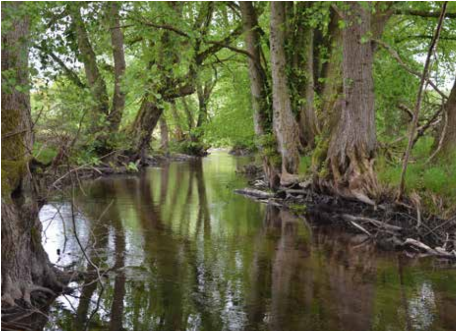
Abbildung 12: Flutterulmen am Mühlenfließ bei Dabelow (Mecklenburg-Vorpommern) – ein markantes Beispiel für die Baumart in ihrer Funktion als Ufergehölz.