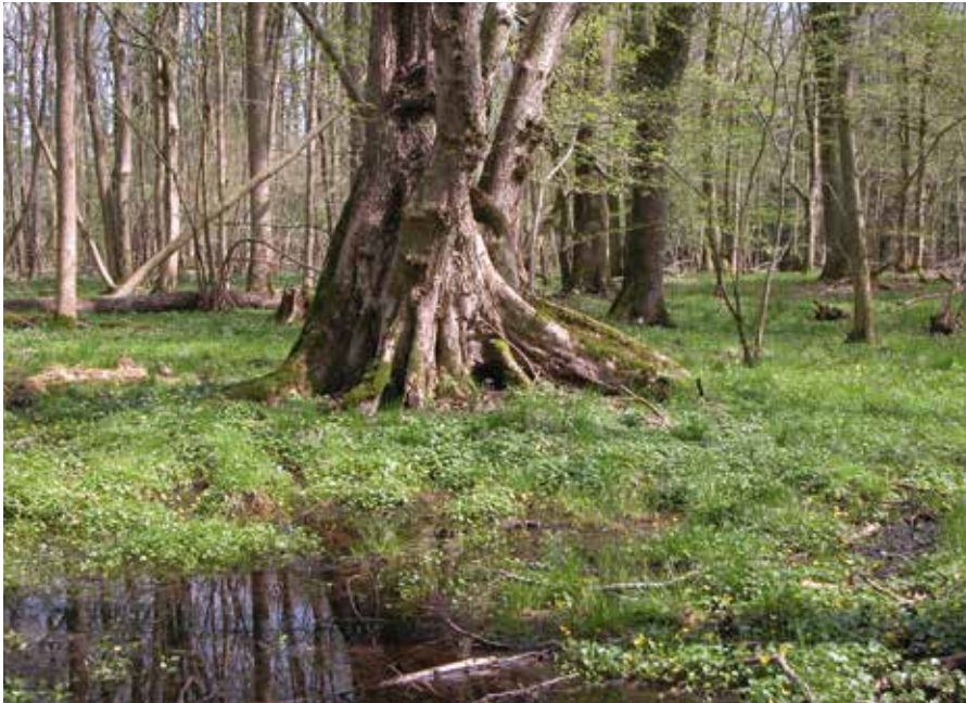
Abbildung 8: In Schleswig-Holstein kommt die Flatterulme vorzugsweise in feuchten bis nassen bachbegleitenden Eschen-Erlenwäldern vor.