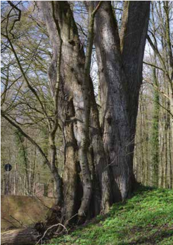
Abbildung 2: Mit 2,07 m BHD wurde dieser Baum am Rande der Störaue als stärkste Flutterulme Schleswig-Holsteins vermessen.