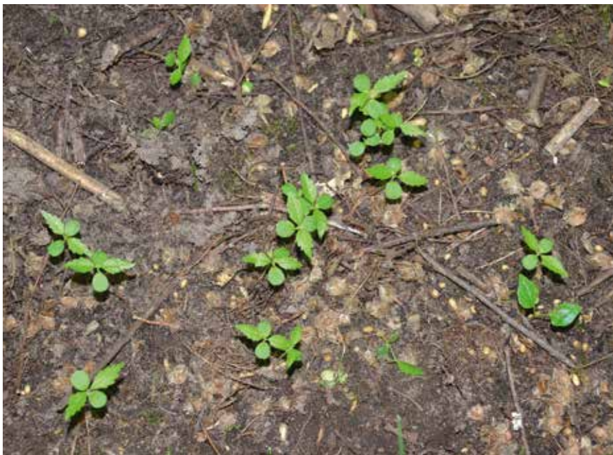
Abbildung 9 (oben): Flutterulmenpflanzung des Frühjahrs 2007 im April 2018.