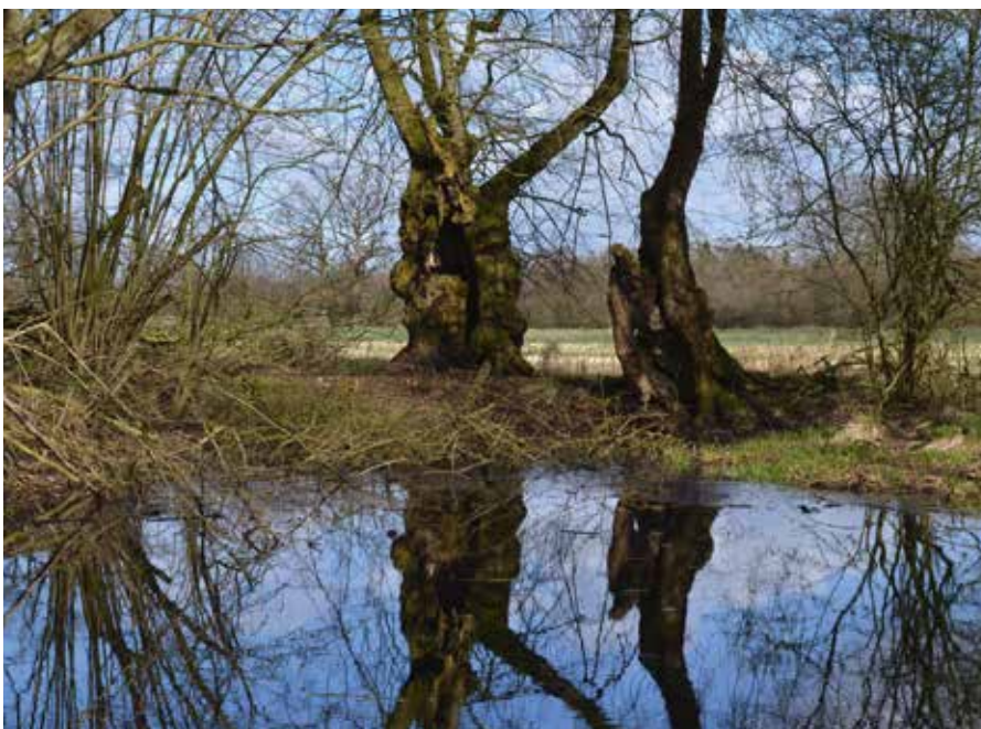
Abbildung 5 (links): Am Rande eines Auengewässers wurden diese alten Flatterulmen früher als »Kopfbäume« gepflegt. Heute sind sie völlig hohl.