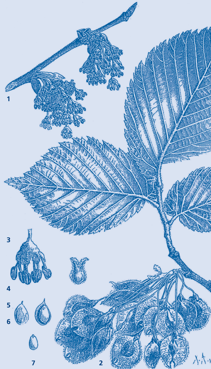
Abbildung: Die Flatterrüster, U. ciliata Ehrh.

Summary: Based on available sources and the results of own recordings, the distribution of European White Elm ( Ulmus laevis ) in Schleswig-Holstein is presented. It encompasses the nature regions of the Eastern Hills and Geest within the whole country, although the species is not present throughout. This can be explained by regional and local differences of land use past and present. The relic occurrences are evaluated as native. Preferred habitats are humid to wet Ash-Alder forests along brooks, sometimes surrounding springs, and sometimes in transition to Oak-Hornbeam forests or Alder carrs. The species most commonly associated with White Elm are Common Ash and Black Alder. White Elm is endangered more strongly through habitat destruction than through Dutch Elm Disease. The species was extensively planted in a school project aiming at brook and floodplain restoration. Raising the trees by their own hands and the subsequent planting was useful for the furthering of nature awareness in the students.