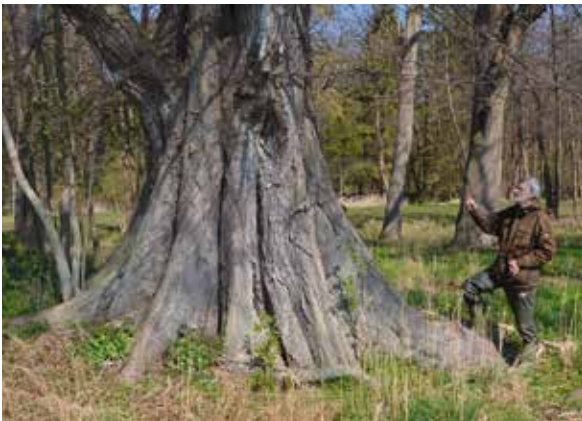
Abbildung 6: Der Autor bestaunt die ausladenden Brettwurzeln einer Flutterulme mit 1,60 m BHD am Oldenburger Graben. Mächtigere Brettwurzelnexemplare waren in Schleswig-Holstein nicht zu finden.

Als Anpassung an derartige wasserbeeinflusste Standorte gelten die bei vielen Exemplaren weit ausladenden, brettartigen Wurzelanläufe, die gewöhnlich als Brettwurzeln bezeichnet werden (Abbildung 6). Von einer Anpassung kann in zweifacher Hinsicht die Rede sein: Zum einen wird die Funktion der Brettwurzeln in der besseren Verankerung des Baumes in nassen Böden gesehen (Roloff 2004), zum anderen soll durch die Brettwurzeln der diffusionsbedingte Lufteintritt in den Holzkörper und somit die Sauerstoffversorgung der Wurzeln verbessert werden, wenn bei längerer Überstauung Sauerstoffarmut im Wurzelraum auftritt (Härdtke et al. 2004). Eigene Untersuchungen an dem Vorkommen im Bereich Alveslohe/Ellerau in Südholstein haben ergeben, dass von 537 erfassten Flutter-