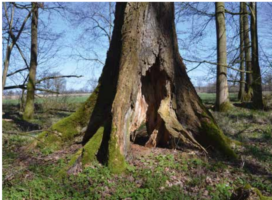
Abbildung 7 (rechts): Die unten hohle Flutterulme ist nur noch durch ihre Brettwurzeln im nassen Boden verankert.

ulmen 50 Individuen in fortgeschrittenem Alter unter Stammfäule litten und im unteren Stammbereich in unterschiedlichen Ausmaßen hohl waren. Das ging bei einigen Exemplaren so weit, dass der Baum nur noch durch die Wurzelanläufe im Boden gehalten wurde, während unmittelbar unterhalb des Stammes keine Verbindung mehr zum Boden bestand (Abbildung 7). Die Brettwurzeln gewährleisteten solchen Bäumen auch an nassen Standorten noch einen ausreichend festen Stand. Andererseits wurden an feuchten und nassen Standorten überwiegend vollholzige und z.T. sogar langschäftige Stämme angetroffen.