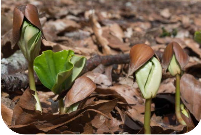
■ Im Frühling entfalten die jungen Buchen die beiden Keimblätter aus den Bucheckern.