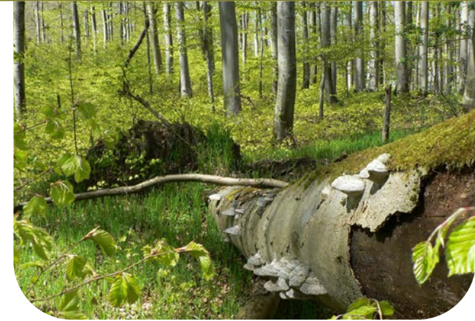
■ Das Totholz der Buche wird gern vom Zunderschwamm besiedelt, der dort seine grauen Konsolen ausbildet.

Bei Untersuchungen im Jahr 2022 konnten zwei Käfer- und eine Kleinschmetterlingsart nachgewiesen werden, die in Bayern auf der »Roten Liste« stehen