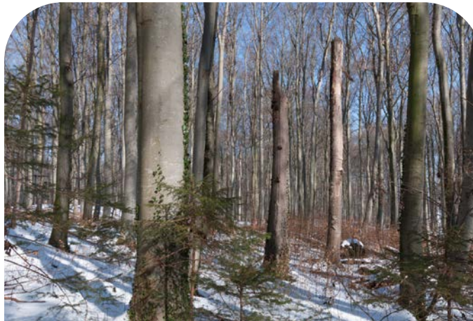
■ Im Winter erlauben die kahlen Bäume und Sträucher einen weiten Blick in das Naturwaldreservat.

Die vielen abgestorbenen Bäume, Äste und Baumkronen bieten zahlreichen auf Totholz spezialisierten Arten einen vielfältigen Lebensraum. So finden sich im Schönwald einerseits Pilzarten wie der Schwefelgelbe Rindenpilz oder der Zusammenfließende Reibeisenpilz, die beide schwächeres Totholz besiedeln. Auf der anderen Seite gibt es beispielsweise mit dem Schuppigen Porling oder der Bläulichgrauen Wachskruste auch Arten, die starkes Totholz benötigen. Außerdem ist an vielen abgestorbenen Buchen der Zunderschwamm zu finden. Die zu den Amöben gehörenden Schleimpilze wurden im Reservat intensiv erforscht. Dabei entdeckten die Wissenschaftler einen bislang unbekanntem Schleimpilz, der seither den Beinamen »schönwaldii« trägt.